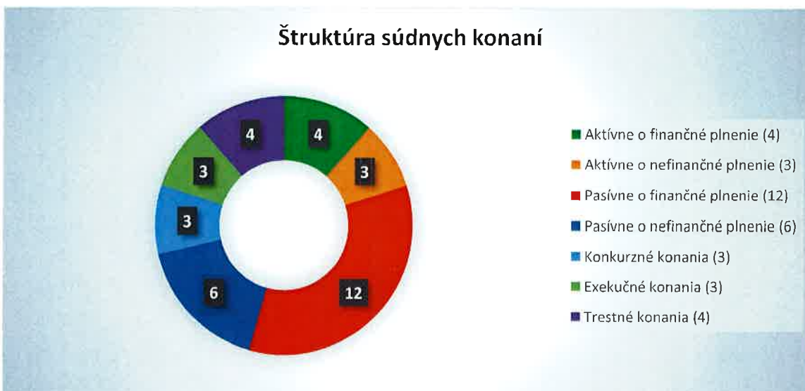
Graf č. 2: Štruktúra súdnych konaní

Poznámka ku grafu: „aktívne“ súdne konania = MH Manažment, a. s. je v postavení žalobcu; „pasívne“ súdne konania = MH Manažment, a. s. je v postavení žalovaného.