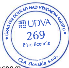
Zodpovedný audítor Bart Waterloos Licencia UDVA č. 1029

CLA Slovakia s.r.o. Karpatská 8 811 05 Bratislava Obchodný register, zložka 74698/B Licencia SKAU č. 269