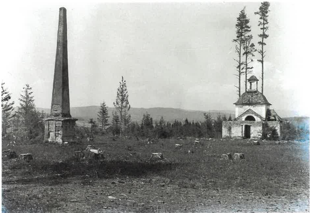
Areál Sans Souci v roku 1932