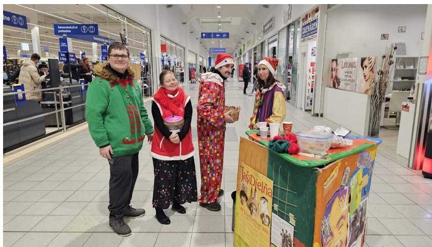
Zbierka v spolupráci s Hypermarket TESCO Žilina