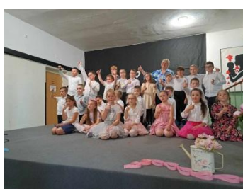
Deň matiek – deti ZŠ