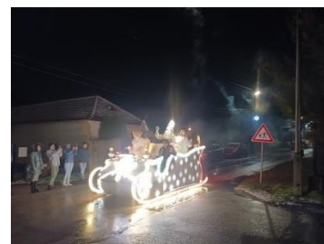
Mikuláš na saniach