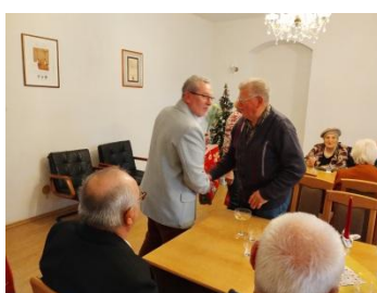
Posedenie s jubilantmi roka