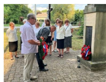
Kladenie vencov SNP