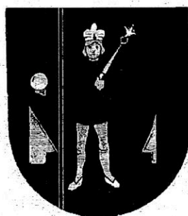
Znak obce Močidl'any

Močidl'any sa roku 1392 spomínajú od menom MOCHILAN. Patrili rovnako ako Popudiny k panstvu Holíč a v rokoch 1730 – 1773 Skalickým jezuitom a potom Habsburgovcom. V 18. storočí sa obec nazývala CZOBORFALVA. Roku 1715 mala obec desať poddanských a trinásť želiarskych domácností, roku 1828 64 domov a 520 obyvateľov. Znak obce Močidl'any je tvorený modrým štítom, kde sa na zelenej pažiti nachádza strieborná postava sv. Štefana v červenom kabátcí, v strieborných nohaviciach a zlatých topánkach, so zlatou korunou na hlave a zlatým jablkom a žezlom v rukách. Po stranách strieborný lemeš a čerieslo. Tento znak pochádza z pečatidla z roku 1777.