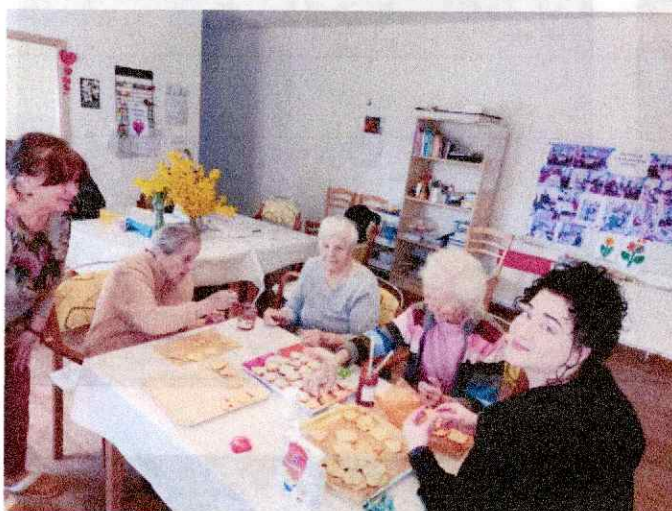
Obr. 4-5 Reminiscenčné pečenie

Prijímatelia sociálnych služieb sa v doprovode personálu zúčastnili Dňa otvorených dverí v Botanickej záhrade UPJŠ v Košiciach a pravidelne realizujú prechádzky v okolí Diakonického centra a neďalekého areálu Univerzity Veterinárneho lekárstva a farmácie v Košiciach. Záujmová činnosť a rozvoj pracovných zručností sa realizovali podľa individuálnych plánov klienta, najmä technikami s prvkami arteterapie, muzikoterapie, biblioterapie a gardenterapie. Rozvíjali sa zručnosti spojené s pečením (Obr. 4-5), tematicky zamerané na sviatky a ročné obdobia. Asistentka sociálnej práce zorganizovala mimoriadne aktivity, ako boli súťaž Zlatý slávik (Obr. 6-7), športový deň a ďalšie pohybové aktivity v interiéri a exteriéri (Obr. 8-11), oslavy narodenín klientov (Obr. 12-13), rôzne tematicky orientované kvízy a kognitívne tréningy (Obr. 14-15).