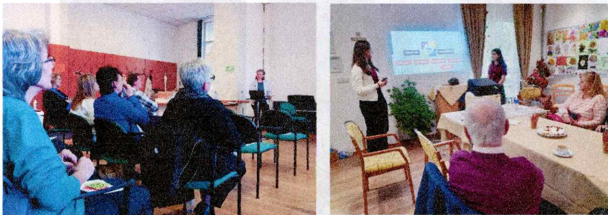
Obr. 22-24 Spoločné stretnutia pre klientov, ich rodinných a formálnych opatrovateľov

Vďaka finančnej podpore vo výške 3.000 € z Nadačného fondu Kaufland sme uskutočnili 35 osobných návštev v prirodzenom domácom prostredí klientov a dve spoločné stretnutia pre klientov, ich rodinných a formálnych opatrovateľov (Obr. 22-24), zapojené boli aj dve VŠ študentky - dobrovoľníčky. Pripravili sme tiež informačné a vzdelávacie materiály, ktoré ďalej využívame pri poskytovaní poradenstva a komunikácii.