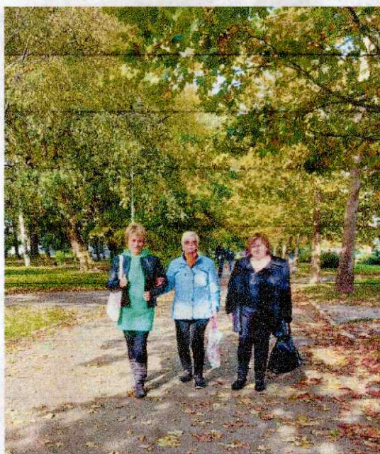
Obr. 1-2 Domáca opatrovateľská služba