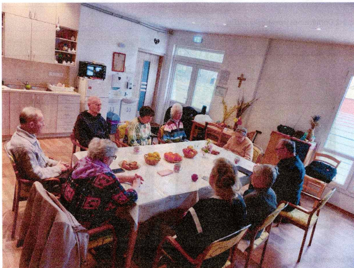
Obr. 3 Stretnutie v rámci biblickej hodiny

Na zabezpečení dennej prevádzky špecializovaného zariadenia sa podieľali: zodpovedná zástupkyňa pre špecializované zariadenie a súčasne sociálna pracovníčka, asistentka sociálnej práce a tri opatrovatelky. Odborní pracovníci špecializovaného zariadenia poskytovali základné sociálne poradenstvo, pomoc pri odkázanosti na pomoc inej fyzickej osoby, stravovanie a sociálnu rehabilitáciu pre udržanie fyzických síl a podporu nezávislosti prijímateľov sociálnej služby.