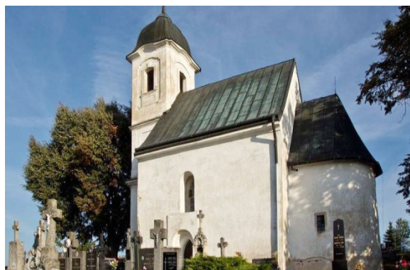
Kostol Všetkých svätých „Rotunda“