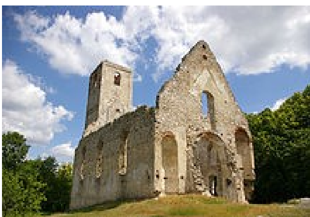
Zrúcaniny kostola svätej Kataríny „Katarínka“