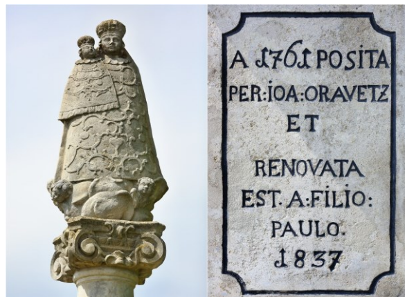
Socha na stĺpe Panna Mária s dieťaťom