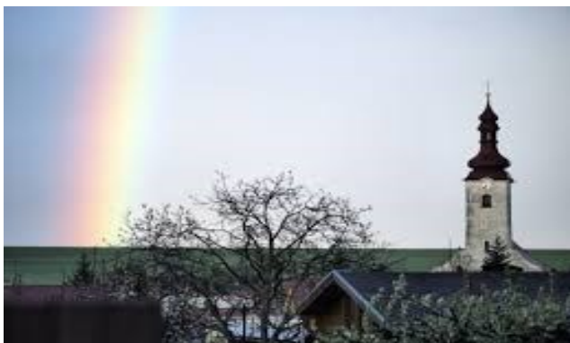
Kostol svätej Kataríny Alexandrijskej (farský kostol)