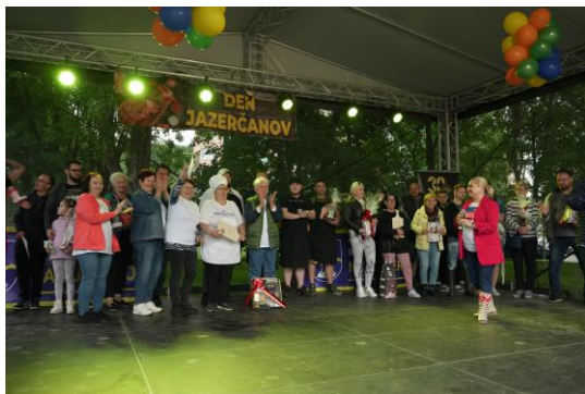
▪ Deň Jazerčanov

Podujatia: Veľká noc - No počkaj zajac, Talent show, Deň učiteľov, Jazero žije - Košické Benátky, Deň Jazerčanov, MDD, Spoznaj behom Jazero, Oceňovanie významných osobností mestskej časti, Vianoce v meste -Rozprávkové vianoce pri Immaculate.