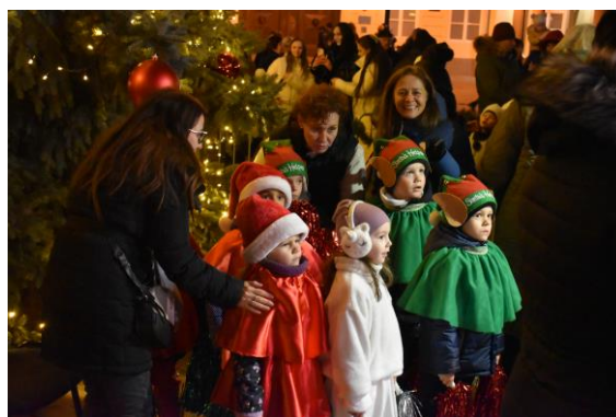
▪ Vianoce v meste