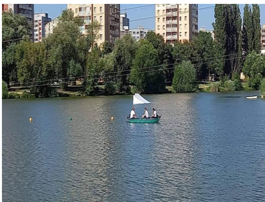
▪ Čistenie jazera