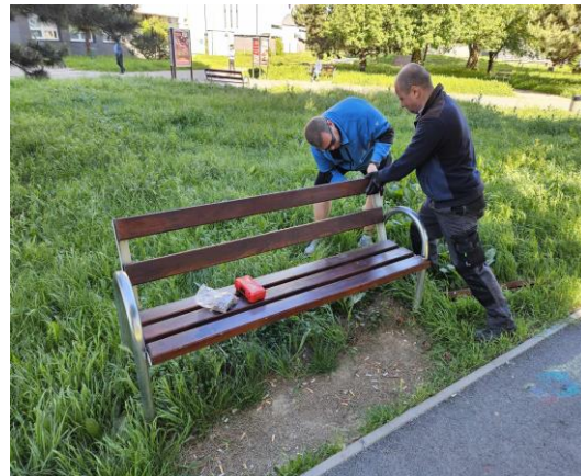
▪ Osádzanie lavičiek