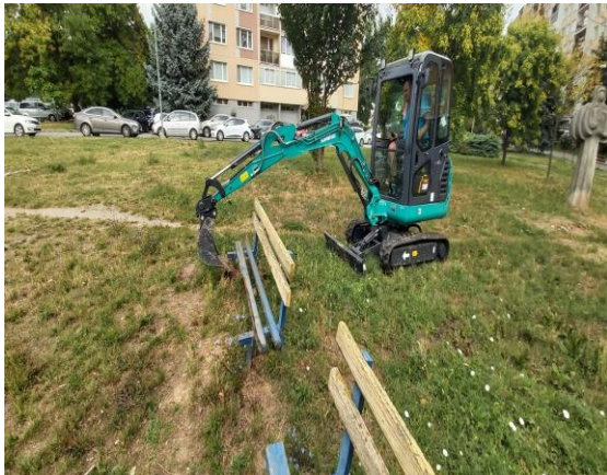
▪ Výmena lavičiek