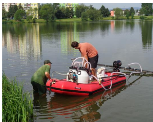
▪ Čistenie jazera