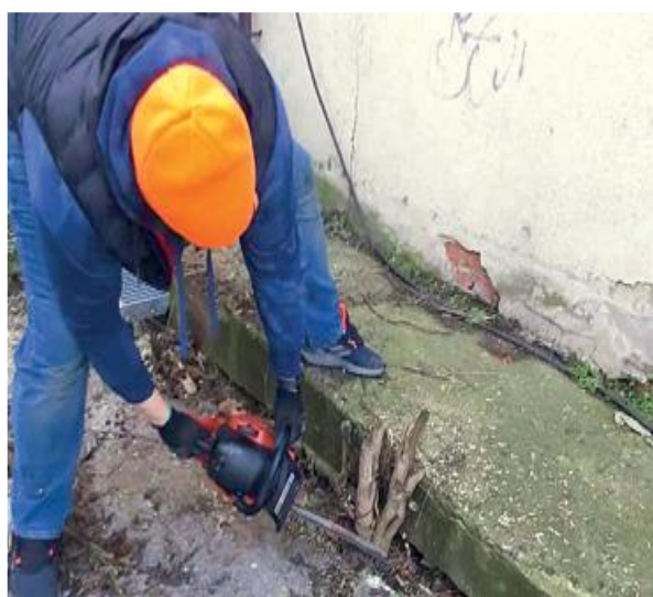
▪ Čistenie sídliska