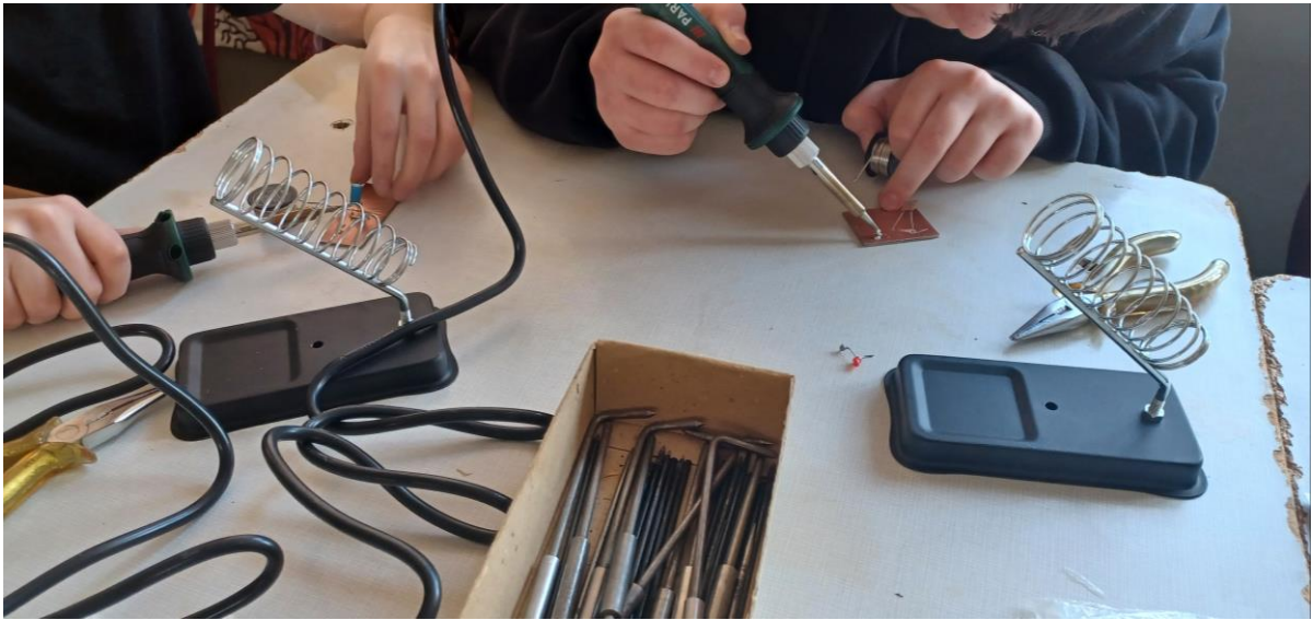
Obr. 8 ZŠ J.A. Komenského, Komárno - projekt na rozvíjanie technického myslenia