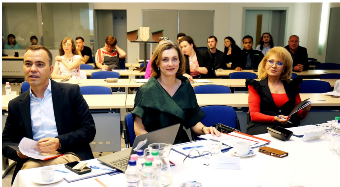
Obr. 5 Projekt „Velvyslanectvo mladých“ 2024 – porota