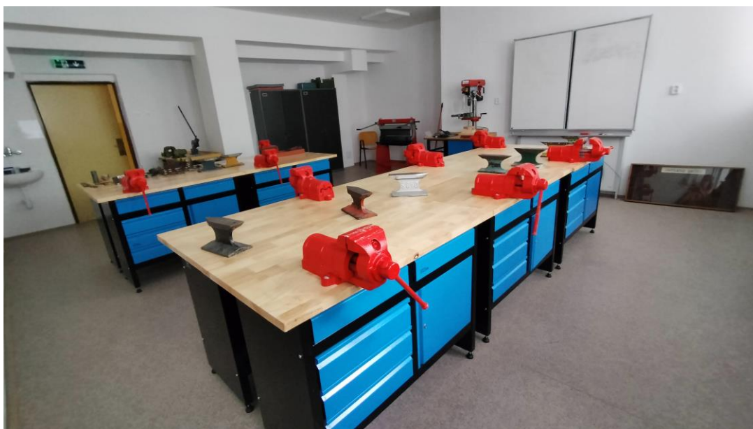
Obr. 6 Modernizovaná učebňa – Katedra techniky a technológii FPV UMB v Banskej Bystrici

Už v roku 2021 sme finančným príspevkom podporili vzdelávací projekt „Bádateľsky orientovaný model vzdelávania vo vybraných technických oblastiach v predmete technika“ na Katedre techniky a technológii FPV UMB v Banskej Bystrici. Keďže spolupráca s touto vysokou školou je veľmi korektná a prínosná pre prípravu budúcich pedagógov, aj v roku 2024 podporila nezisková organizácia ďalší projekt uvedenej fakulty. Finančnými prostriedkami vo výške 2.880,00 Eur sme pomohli projektu, ktorého cieľom bolo vybavenie učebne na ručné spracovanie kovov a plastov. Katedra aktívne reaguje na pripravované zmeny v rámci prípravy a zavádzania nového Štátneho vzdelávacieho programu, ktorý sa prioritne zameriava na naplnenie potrieb vzdelávania pre 21. storočie. V súvislosti s tým sa katedra rozhodla aj pre rekonštrukciu a modernizáciu jej učební. Obsahom celého projektu bola náhrada zastaranej techniky, zaobstaranie nových moderných nástrojov a zariadení, učebných pomôcok a vytvorenie moderného učebného priestoru pre budúcich pedagógov. Vďaka finančnému príspevku katedra zakúpila nové vybavenie dielne ako pracovné stoly, skrine, náradie alebo aj dataprojektor.