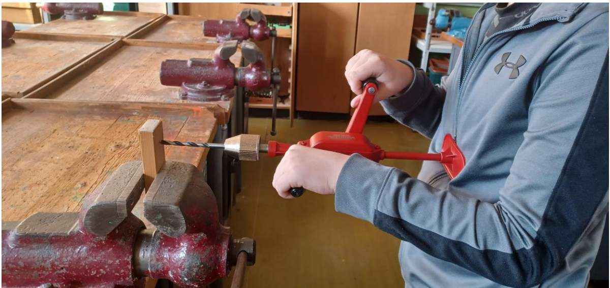
Obr. 9 ZŠ J.A. Komenského, Komárno - projekt na rozvíjanie technického myslenia