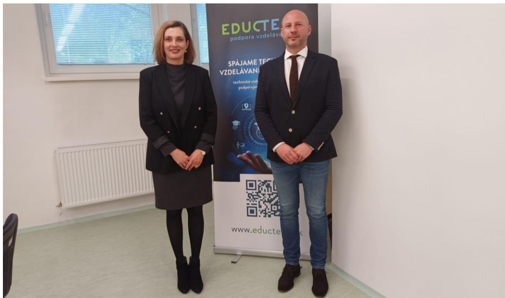
Obr. 2 Celoštátne kolo Technickej olympiády v školskom roku 2023/24