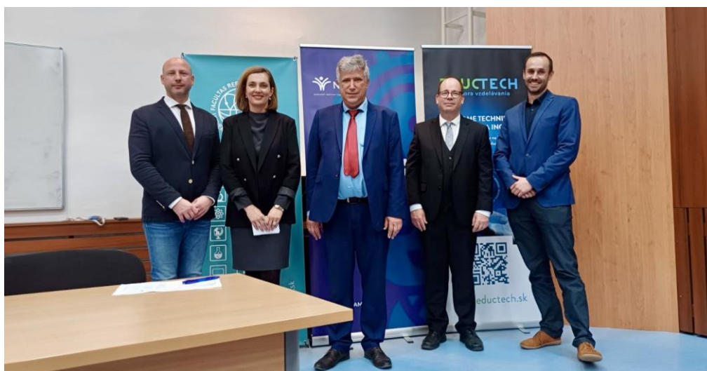
Obr. 1 Celoštátne kolo Technickej olympiády v školskom roku 2023/24

Od školského roku 2016/2017 je Eductech, n.o. pravidelným partnerom Technickej olympiády, keďže podpora technického vzdelania a všetkého čo s ňou súvisí je našou prioritou. Vďaka tomu môžeme oceniť a podporiť snahu a šikovnosť nadaných mladých ľudí s reálnym záujmom o technické predmety. Aj v školskom roku 2023/2024 sme podporili celoštátne kolo Technickej olympiády, ktorá ako jediná z olympiád pre žiakov základných, hodnotí okrem teoretických vedomostí aj zručnosti žiakov. Už 14-ty ročník celoštátneho kola Technickej olympiády sa konal na Fakulte prírodných vied UMB v Banskej Bystrici. Súťaže sa zúčastnili dvojice žiakov 8. – 9. ročníka základných škôl z celého Slovenska. Dvojice víťazov, ktoré sa umiestnili na prvých troch priečkach sme odmenili atraktívnymi cenami. Veríme, že im budú prínosom v ďalšom vzdelávaní a aj takáto podpora im pomôže v snahe a motivácii zlepšovať sa a dosahovať pekné výsledky a úspechy aj v budúcnosti.