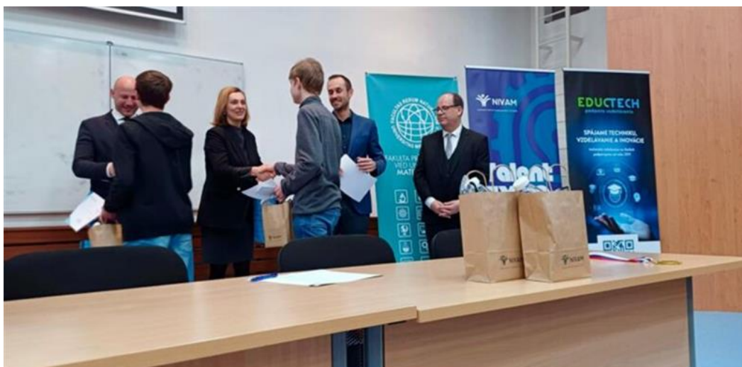
Obr. 3 Celoštátne kolo Technickej olympiády v školskom roku 2023/24