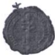
Pečať „mestečka“ Slovenská Ves