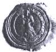
Najstaršia pečať obce

Pečať obce: Obec Slovenská Ves, hoci nebola mestom ani mestečkom, mala svoju kancelársku činnosť už od 16.storočia. Dôkazom toho je jej pečať, ktorá pochádza z tohto obdobia. V pečati je vyobrazená patrónka obce panna Mária s Dieťaťom na pravej ruke, stojaca na polmesiaci, v pozadí so svätožiarou. Mala priemer 2,8 cm a kruhopis. S.DES MITELS VINCZENDORF (pečať mestečka Slovenská Ves)