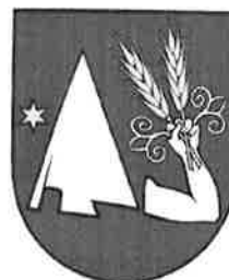
Obr.č.5 Vlajka, pečať, erb

Heraldická komisia Ministerstva vnútra Slovenskej republiky prerokovala návrh erbu obce Podlužany a odporučila ho na prijatie obecným zastupiteľstvom a na zaevidovanie do Heraldického registra SR v tejto podobe: