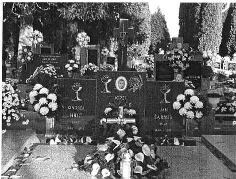
Hrob Jozefa Nováka na čajkovskom cintoríne