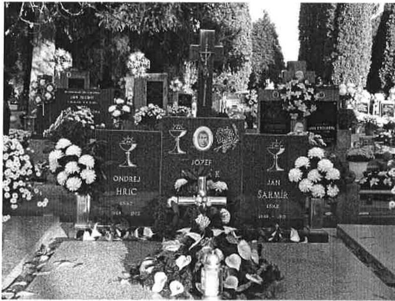
Hrob Jozefa Nováka na čajkovskom cintoríne