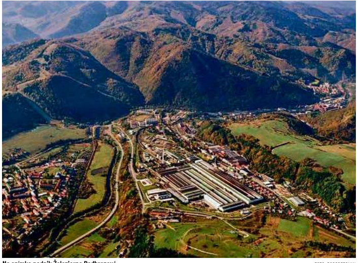
Na snímke podnik Železiarne Podbrezová.

Róbert Turza robert.turza@maftraslovakia.sk