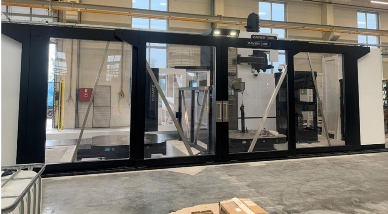
Obrázok 4 Fréza ZEYER KAIROS, Muehlbauer Technologies s.r.o., Nitra

Každý sektor prináša nové výzvy v oblasti technológie, certifikácie aj projektového riadenia, ktoré úspešne zvládame vďaka skúsenému tímu a vysokým štandardom kvality.