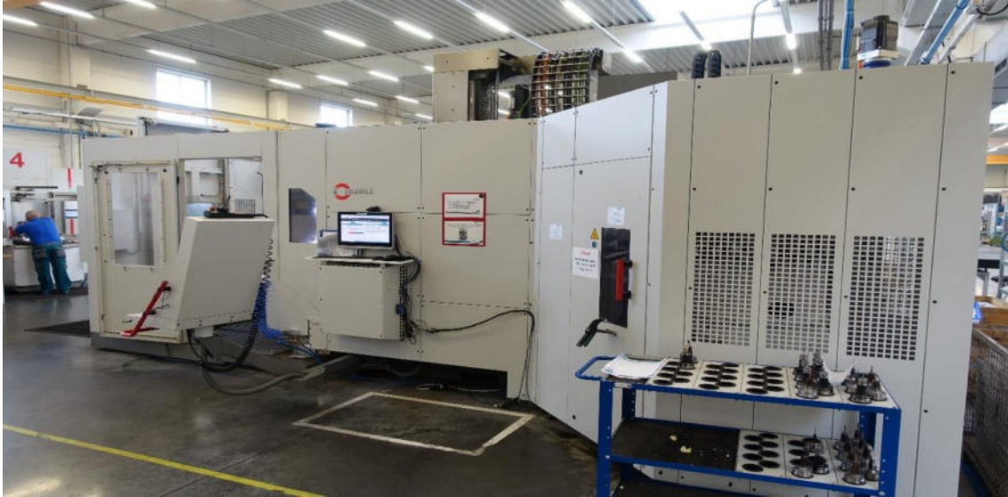
Obrázok 2 Fréza Hermle C42, Muehlbauer Technologies s.r.o., Nitra

Na oddelení prípravy výroby a kalkulácii sa udiali zmeny v oblasti plánovania zákaziek a to konkrétne pre frézovacie technológie, kde oddelenie Prípravy výroby (AV) dostalo plnú kompetenciu na plánovanie práce pre celú divíziu MPS a tvorbu kalkulácii a postupov na interných zákazkách. V roku 2023 pokračovali investície do výstavby novej haly a novej techniky, vrátane práškovacej linky – automatickej aj manuálnej, pieskovacej kabíny, automatickej linky na obrábanie plechov, laserového rezacieho stroja, CNC posuvnej stĺpovej frézy a zvárackej techniky (centrálne odsávanie, rúrový laser, regále do skladu, otočné, zvaračské stoly, zvaračky 13 ks MAG, 2ks TIG, indukčný ohrev na rovnanie). Výroba participovala na spracovávaní objednávok pre existujúce sériové projekty DSRP / Stroje MTT a Merlin.