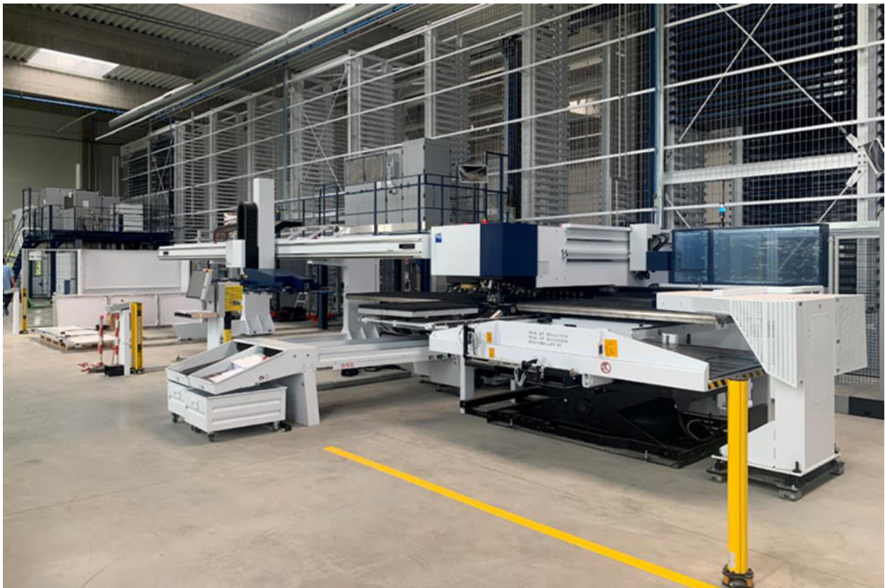
Obrázok 3 Oddelenie spracovania plechov s Automatickým sklantom STOPA, Muehlbauer Technologies s.r.o., Nitra

S novými možnosťami spracovania sme rozšírili našu ponuku na trhoch s vysokými nárokmi na presnosť a spoľahlivosť produktov.