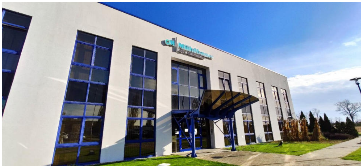
Obrázok 1 Muehlbauer Technologies s.r.o., Nitra