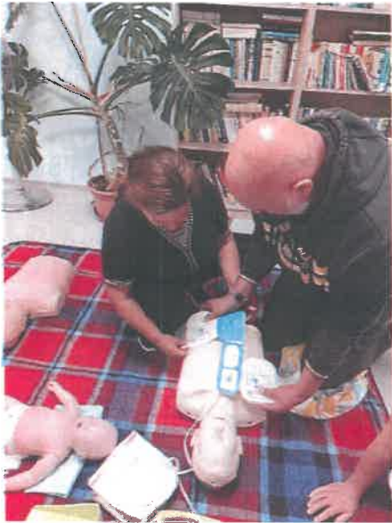
Kurz prvej pomoci