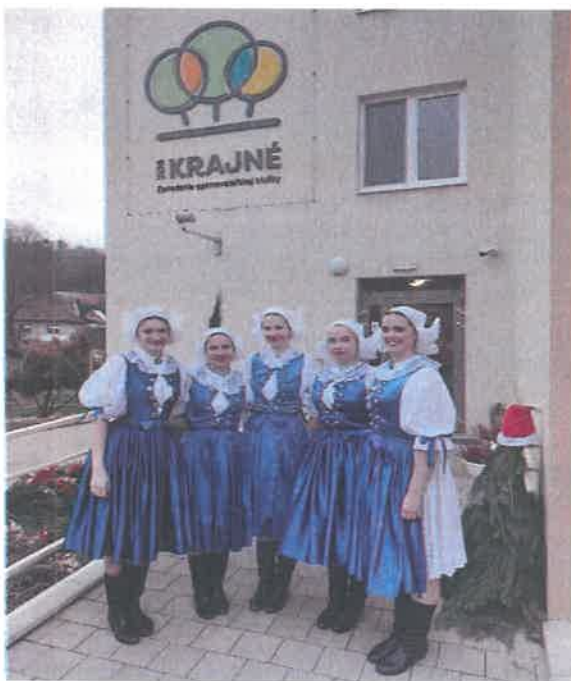
Vystúpenie FS Kopaničiar