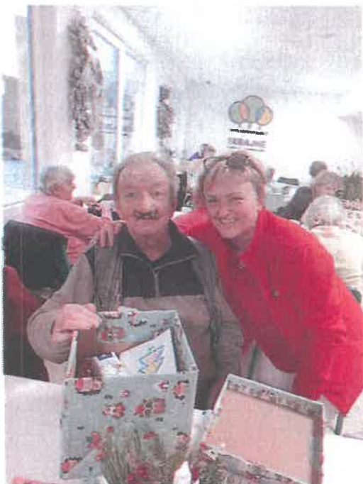
Vianočné darčeky – „Koľko lásky... „