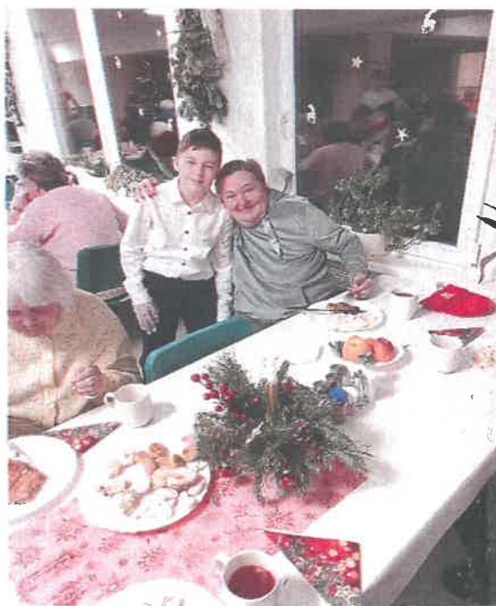
Spoločná vianočná večera