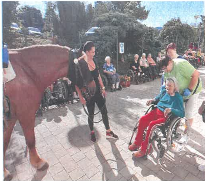
Návšteva koní z ranču Narisa