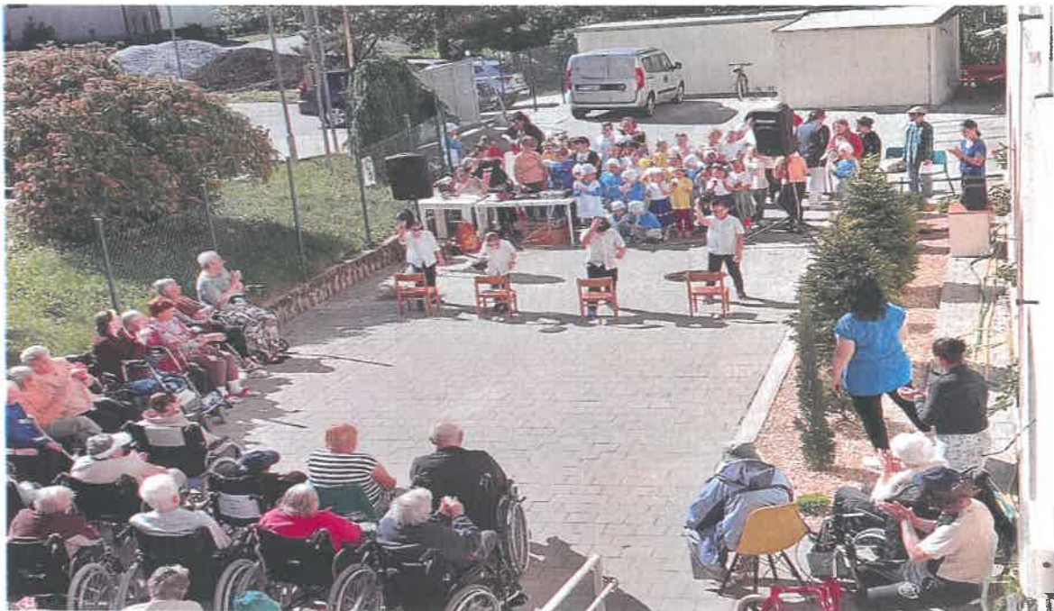
Vystúpenie detí zo ZŠ a MŠ Krajné