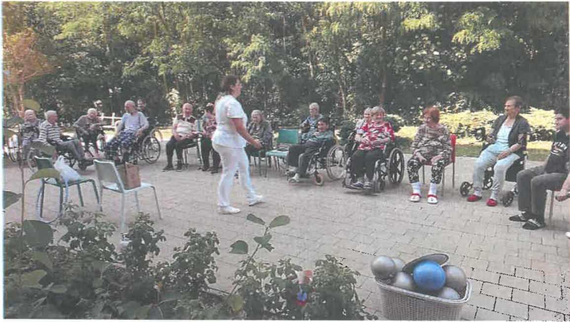
Spoločné cvičenie v záhrade