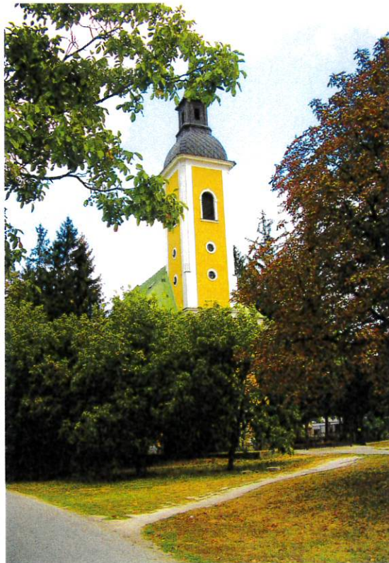
Obr. Kostol navštívenia Panny Márie