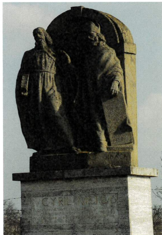
Obr. Socha sv. Cyrila a Metoda v miestnych vinohradoch