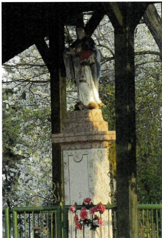
Obr. Socha sv. Urbana