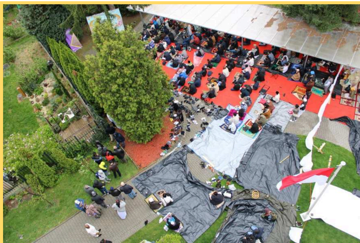
Spolupráca Islamskej nadácie na Slovensku a Indonézskeho veľvyslanectva v praxi.