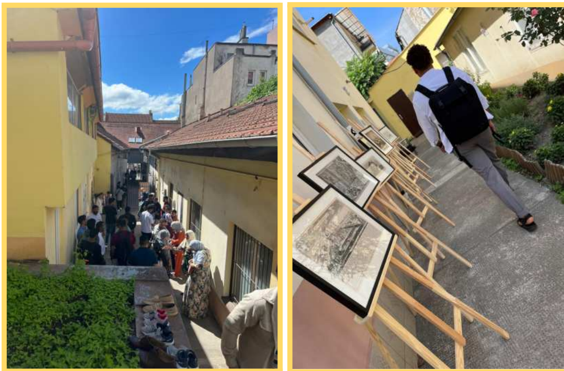
Centrum je početne navštevované celoročne, čo dokazuje jeho význam.

Názov centra je inšpirovaný andalúzskym mestom Córdoba – symbolom mierového spolunažívania kultúr, náboženstiev a národností. V duchu tohto odkazu už viac než 15 rokov organizuje pod záštitou INS vzdelávacie, kultúrne a komunitné aktivity, ktoré podporujú rozmanitosť, vzájomné porozumenie a udržateľný dialóg aj v slovenskom kontexte.