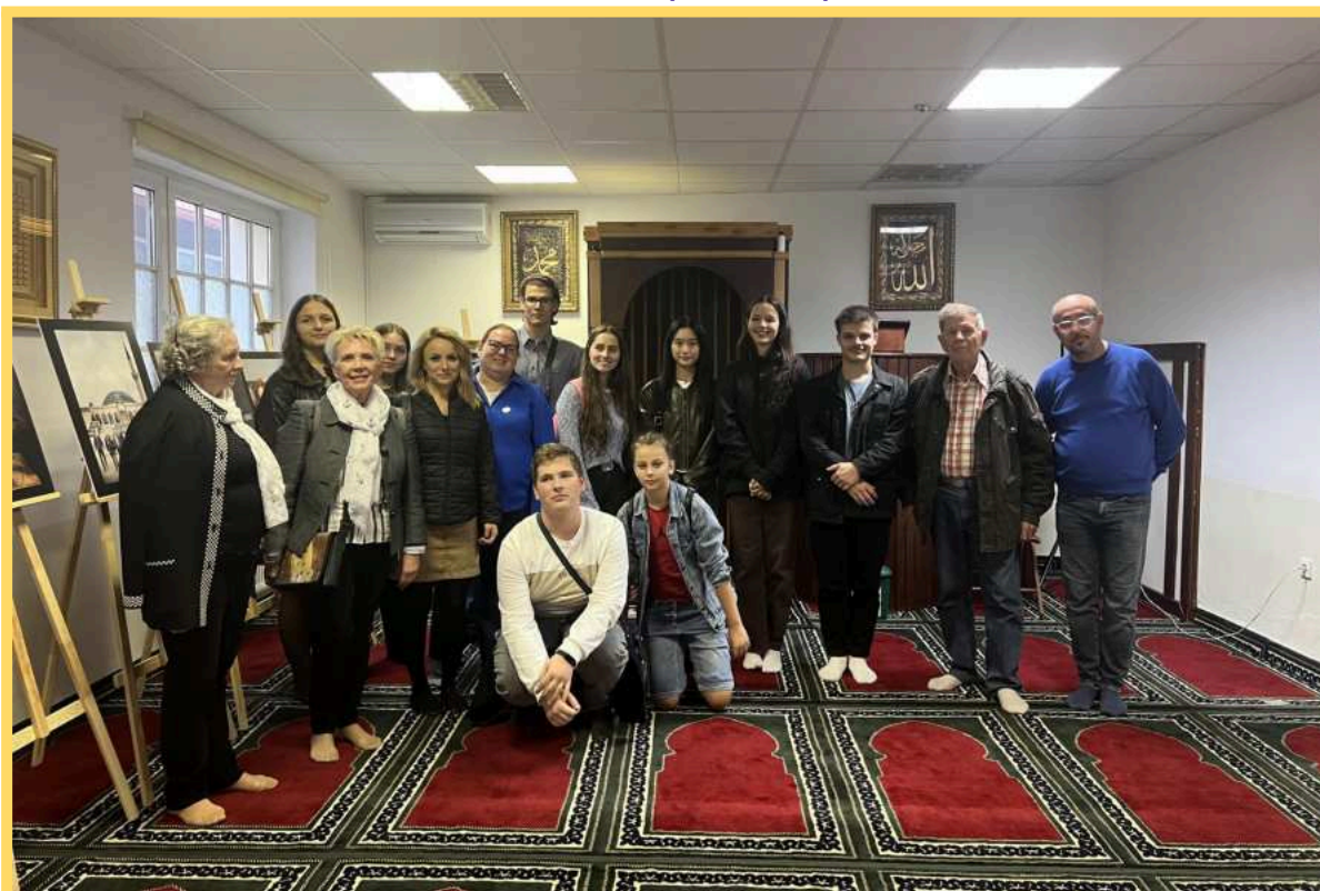
Osobné stretnutia ako mosty porozumenia – medzinárodná skupina návštevníkov na exkurzii spojenej s tematickou prednáškou a výstavou fotografií.