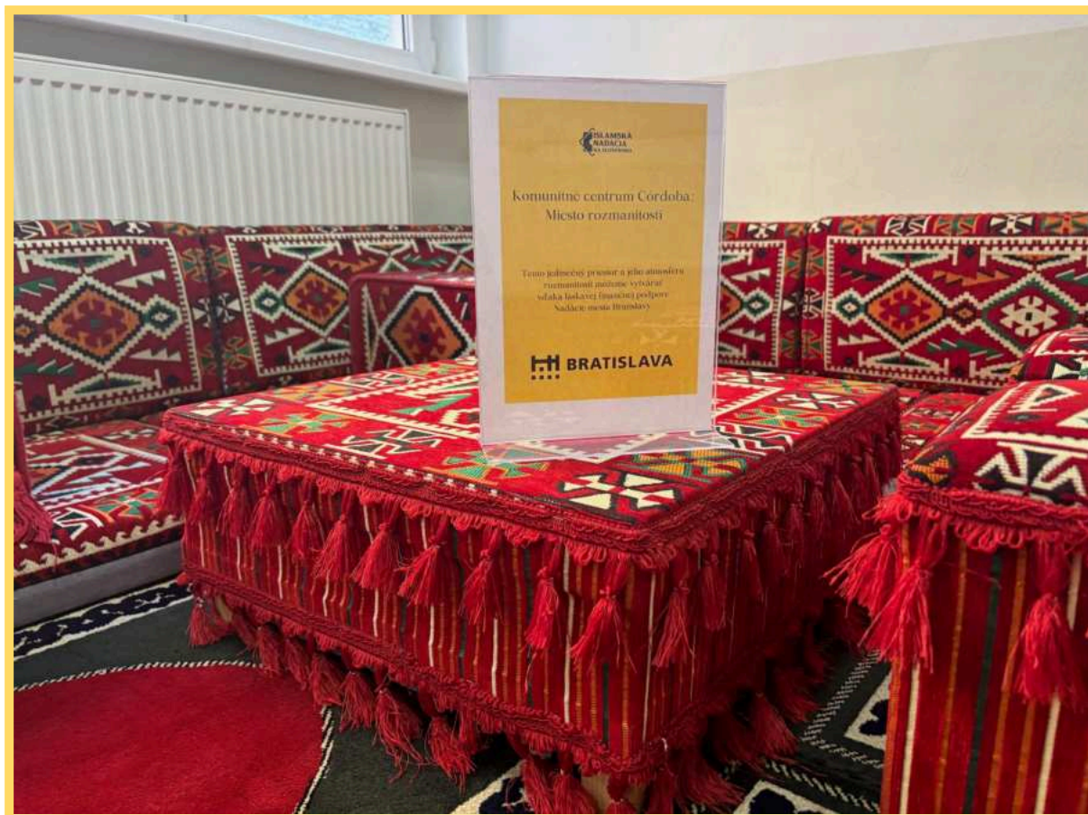
Autentická obývačka v štýle majlis patrí medzi najobľúbenejšie prvky centra.