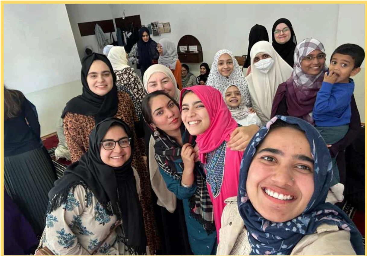
Diverzita v praxi: zahraničné študentky programu Erasmus a ženy z tretích krajín žijúce na Slovensku.

INS prevádzkuje kultúrno-komunitné centrum Córdoba v centre Bratislavy – otvorené 365 dní v roku pre ľudí rôzneho pôvodu a názorov. Svojimi pravidelnými aj projektovými aktivitami posilňuje dôveru, komunitný život a vzájomné porozumenie, súžitie.