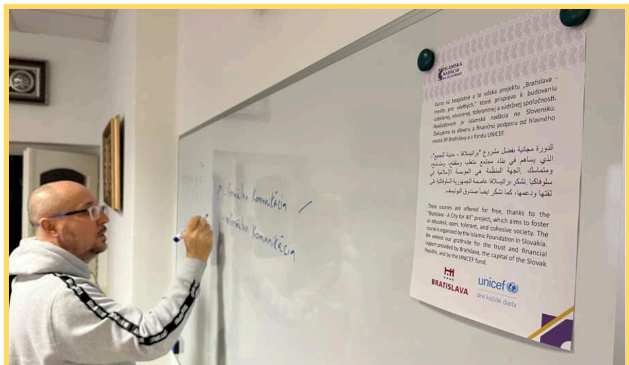
Letná jazyková škola arabského jazyka pre širokú verejnosť realizovaná v roku 2024.