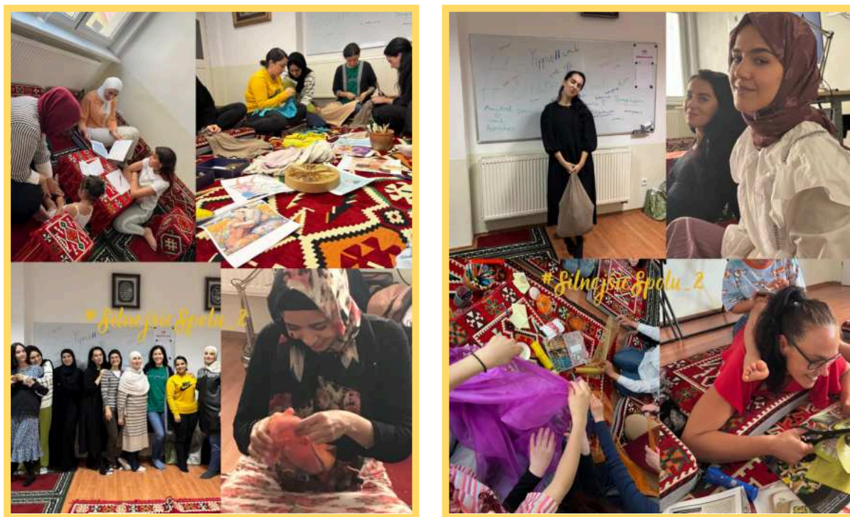
Fotokoláže z podujatí realizovaných v rámci projektu.