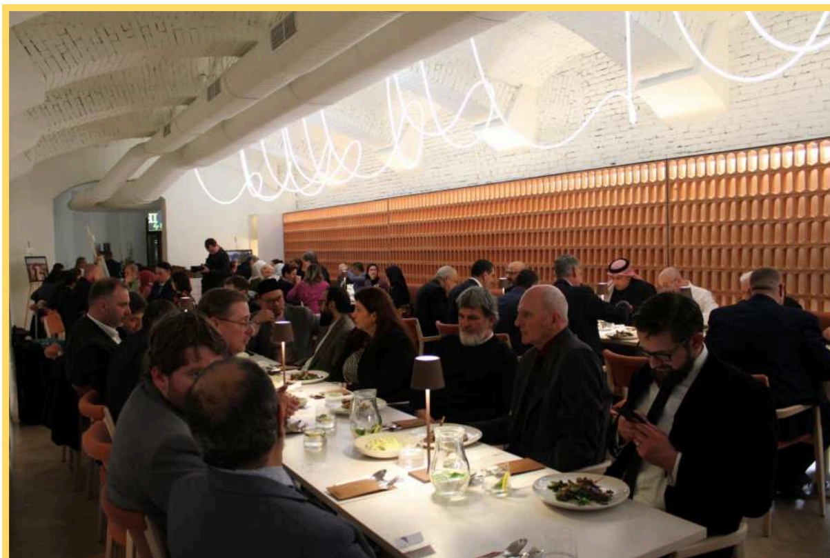
Spoločné prerušenie pôstu v spoločnosti výnimočných hostí.