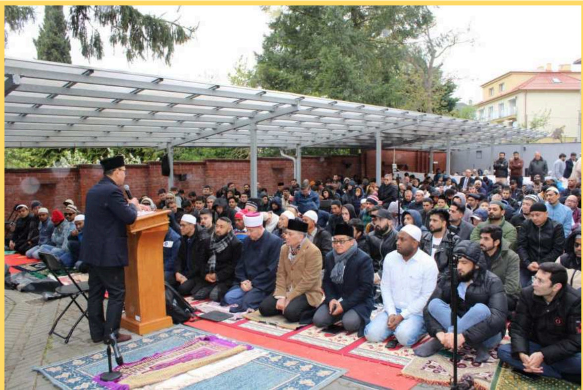
Oslava sviatku Íd al-Fitr na záhrade Indonézskeho veľvyslanectva v Bratislave – stretnutie predstaviteľov diplomatického zboru a moslimskej komunity.