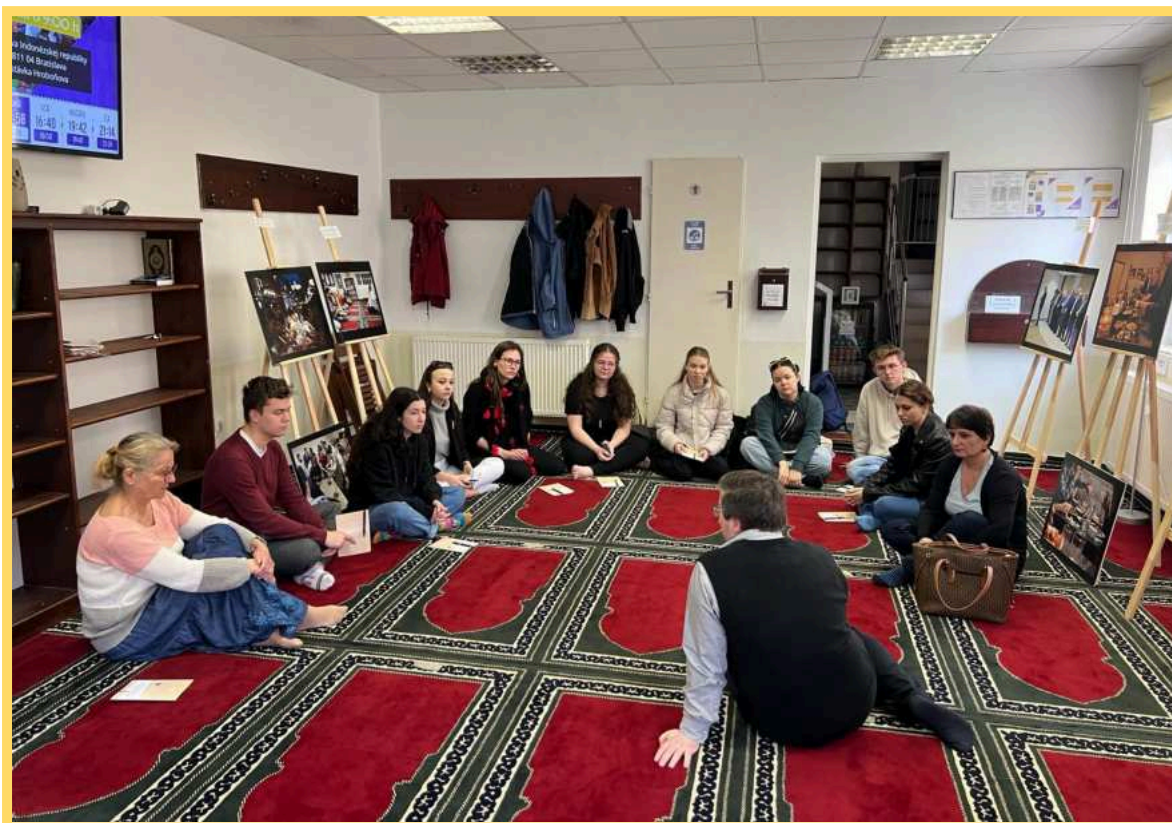
Nie úplne všedná prednáška pre vysokoškolských študentov z Ústavu manažmentu kultúry a turizmu, kulturológie a etnológie Filozofickej fakulty Univerzity Konštantína Filozofa v Nitre – priamo v priestoroch nadácie.