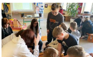
Infocentrum Europe Direct tiež realizuje prednášky o kritickom myslení pre žiakov a študentov na území regiónu.