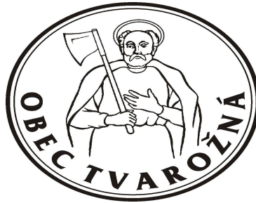
OBR. Č. 4: PEČAŤ OBCE TVAROŽNÁ

V pečati sa vyskytuje horná časť postavy svätého Mateja odetého v plášti, s gloriolou okolo hlavy, ako drží v pravej ruke sekeru opretú o plece.