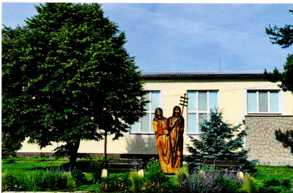
Priestor pred Kultúrnym domom v Považanoch.