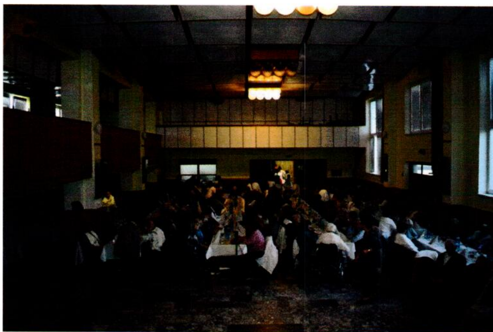
Stretnutie dôchodcov z Považian a Potvoríc, v rámci mesiaca úcty k starším, konaného dňa 11. októbra 2024.

Hospodárenie obce v nadchádzajúcich obdobiach ako i realizácia plánovaných rozvojových projektov našej obce budú do značnej miery ovplyvnené výškou príjmov obce (výpadkom podielových daní), rastúcou cenou stavebných materiálov, rastúcou výškou ceny práce, zvyšujúcou výškou minimálnej mzdy, zvyšovaní cien energie , rastúcou infláciou ako i transakčná daňou. Toto sú všetko negatívne skutočnosti, ktoré budú v budúcnosti i negatívny dopad na hospodárenie obce.