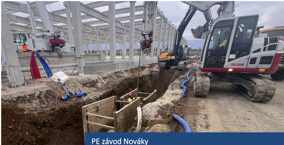
PE závod Nováky

Začalo sa s výstavbou nového výrobného závodu v Novákoch. V novom výrobnom závode sa bude vyrábať väčšina komponentov pre hnaciu sústavu elektrických vozidiel. Výrobný proces pohonnej jednotky sa bude skladať zo štyroch základných operácií: montáž statora, montáž motora a reduktora, montáž meniča a finálna montáž PE motora. Kompletná pohonná jednotka sa po presune do skladu pripraví na expedíciu do výrobných závodov.