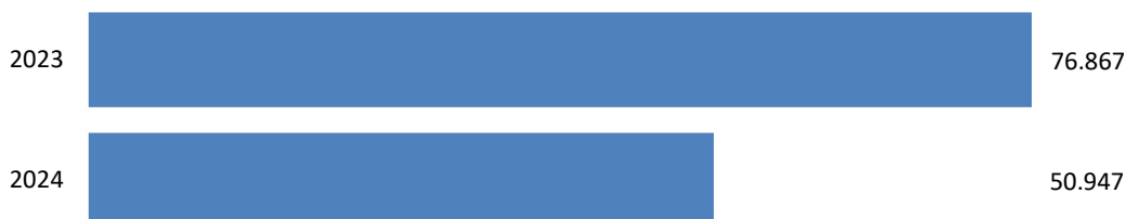
GRAF 1 • VÝNOSY Z HOSPODÁRSKEJ ČINNOSTI v tis. €

Počet predaných áut v roku 2024 bol v porovnaní s rokom 2023 aj 2022 vyšší. (Tabuľka 3).