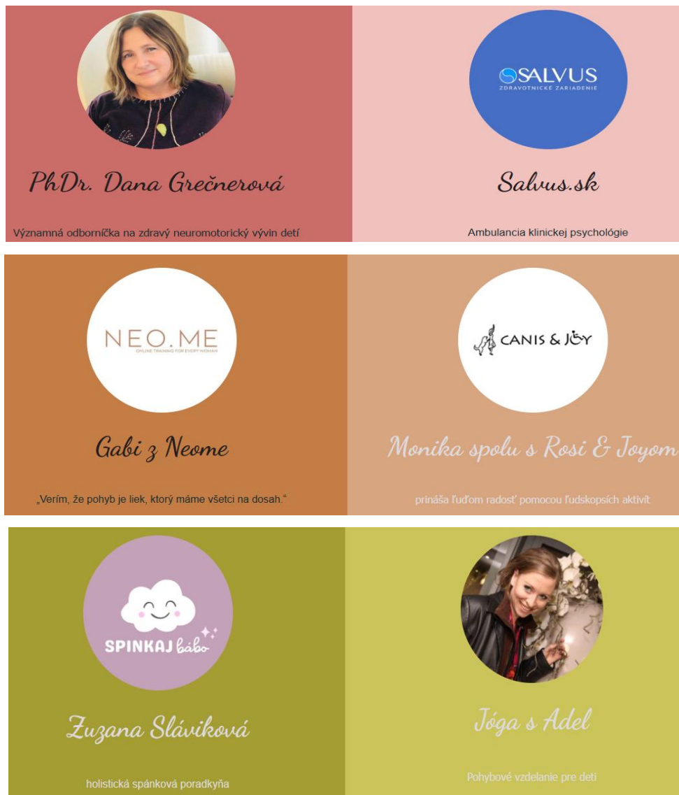
Obrázok 2 Odborníci spolupracujúci s našim zariadením, okrem kmeňových zamestnancov

Profesijná zostava predstavuje skupinu výnimočných odborníkov a spolupracujúcich organizácií, ktoré s láskou a odborným prístupom podporujú zariadenie A la Maison care, zamerané na starostlivosť o deti do troch rokov veku. Ich spoločným cieľom je vytvárať bezpečné, podnetné a láskavé prostredie, v ktorom sa deti môžu prirodzene rozvíjať a rásť.