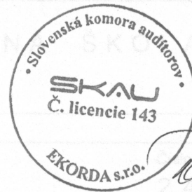
E K O R D A, s.r.o. Révová 45, Bratislava Licencia SKAU 143