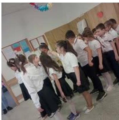
Láska kvitne v každom veku Kol'ko lásky o.z.