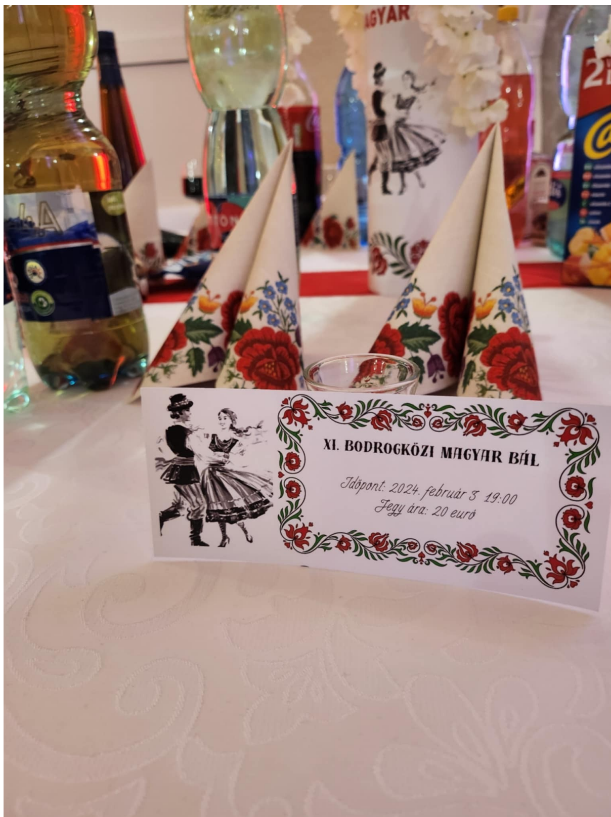
Príloha č. 1- Malý Horeš, Maďarský bál – 3.2.2024