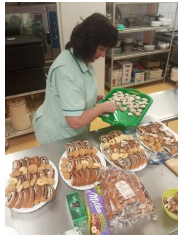
Príprava štedrovečernej večere