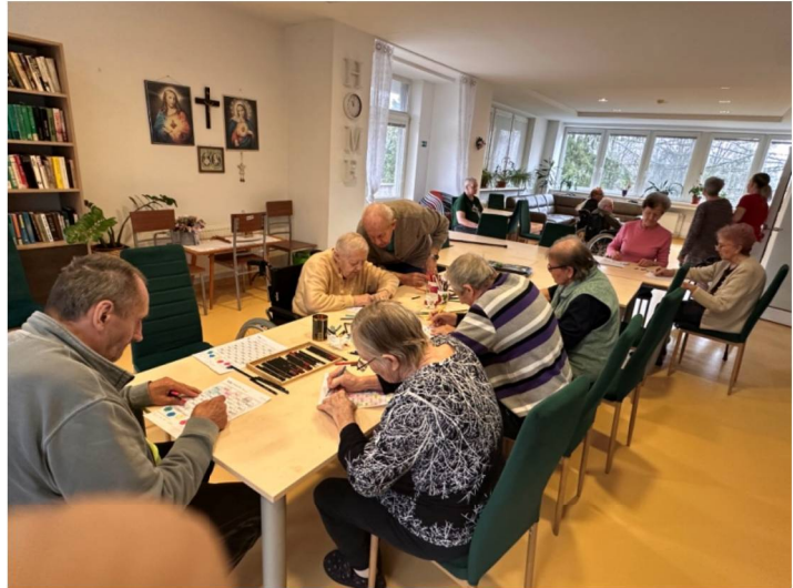
Nácvik jemnej motoriky: vyfarbovanie