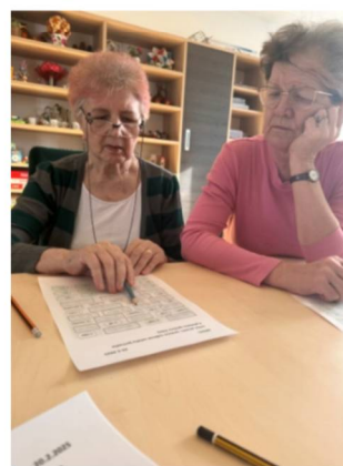
Precvičovanie pamäte: čítanie, počítanie, lúštenie.