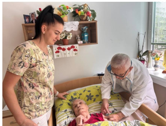
Očkovanie prijímateľov proti chrípke