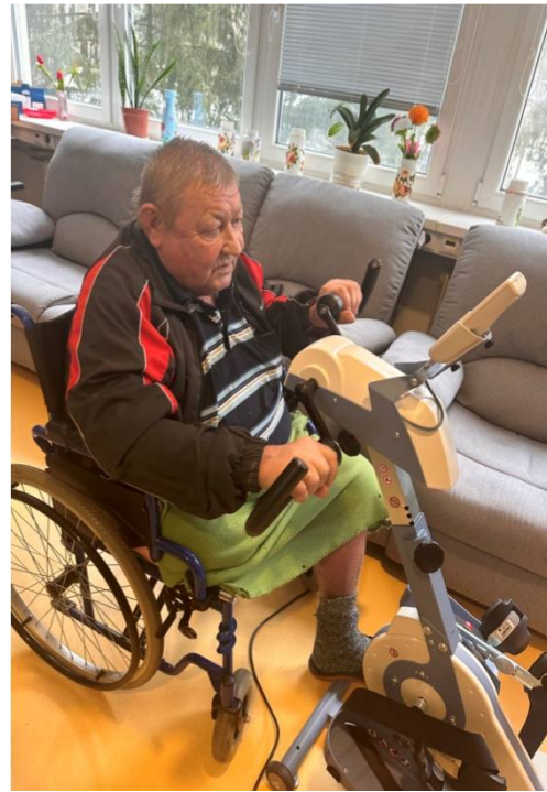
Cvičenie horných a dolných končatín na liečebnom pohybovom stroji