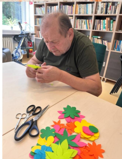
Nácvik jemnej motoriky: strihanie, lepenie.