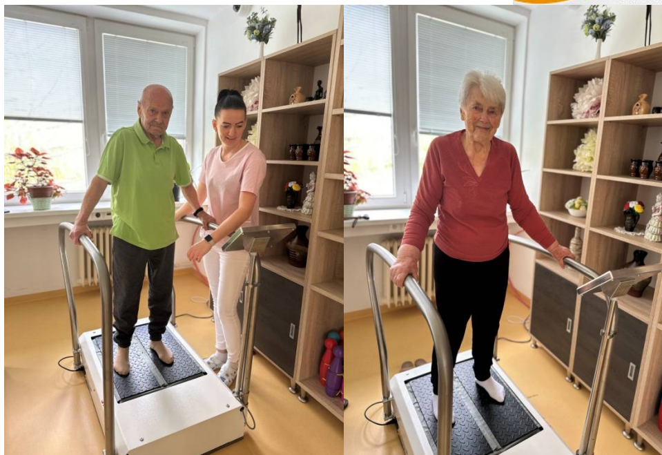
Terapia na rezonančnom stochastickom stroji