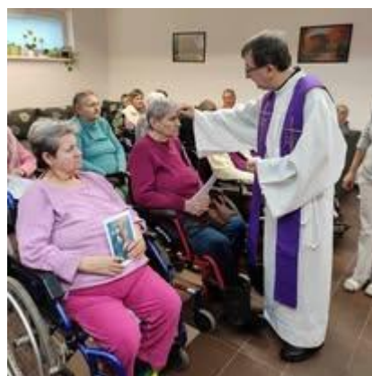
Svätá omša v zariadení