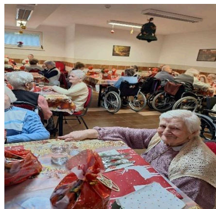
Štedrý večer v zariadení