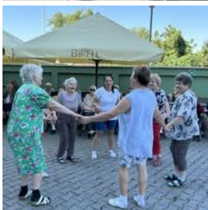
Výlet do Panthera parku