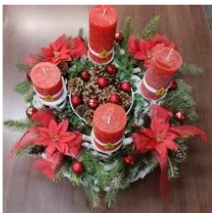
Advent v zariadení