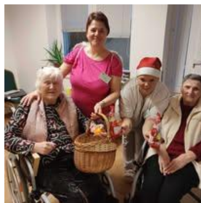
Mikuláš v zariadení