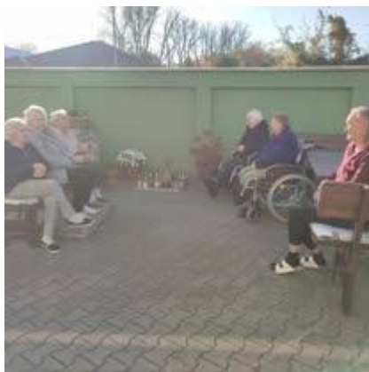
Spomienka na zosnulých