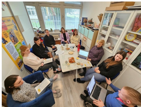
Vzdelávanie tímu CVI TT, n.o. spoločne s tímom Ranej starostlivosti, n.o. o ľudských právach

Piaty zamestnanci sa zúčastnili vzdelávania o ľudských právach a tiež o ťažkostiach s jedením u detí. Pravidelne počas roka 2024 sa tím zamestnancov zúčastňoval viacerých konzultácií ku skvalitneniu štandardov poskytovanej sociálnej služby i supervízie cez pravidelné stretávanie sa tímu CVI ohľadom štandardov kvality poskytovanej sociálnej služby.