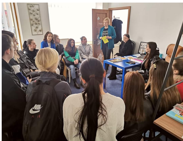
Študenti UCM v priestoroch CVI TT na Františkánskej 5