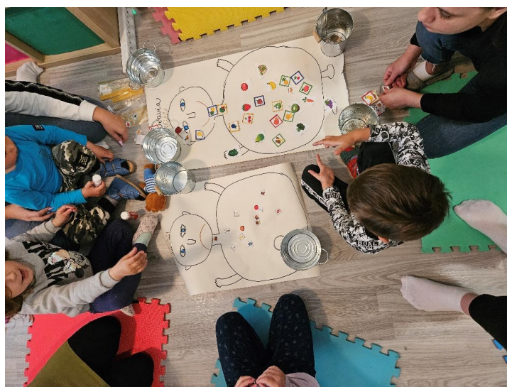
Deti pri skupinovej aktivite počas Školaklubu

Pravidelne v stredu dopoludnia sme ponúkli rodičom detí, ktoré nenavštevujú materskú školu alebo ich deti mali v MŠ ťažkosti s adaptáciou, nedostatočnými sociálnymi alebo jazykovými zručnosťami možnosť navštevovať Školaklub. Aktivita sa stretla s veľkým záujmom zo strany rodičov. Umožnila viacerým deťom adaptáciu na skupinu a budovanie sociálnych zručností u detí.