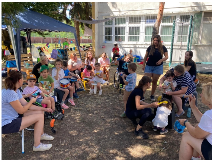
Účastníci 6. Denného inkluzívneho tábora počas hudobnej aktivity

Pravidelne v stredu dopoludnia sme ponúkli rodičom detí, ktoré nenavštevujú materskú školu alebo ich deti mali v MŠ ťažkosti s adaptáciou, nedostatočnými sociálnymi alebo jazykovými zručnosťami možnosť navštevovať Školaklub. Aktivita sa stretla s veľkým záujmom zo strany rodičov. Umožnila viacerým deťom adaptáciu na skupinu a budovanie sociálnych zručností u detí.