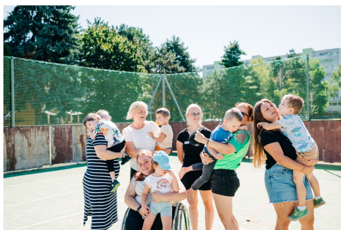
Dobrovoľníčky CVI TT počas Denného tábora s účastníkmi tábora