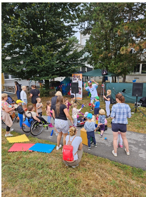
Dobrovoľníci CVI Trnava s účastníkmi Denného inkluzívneho tábora