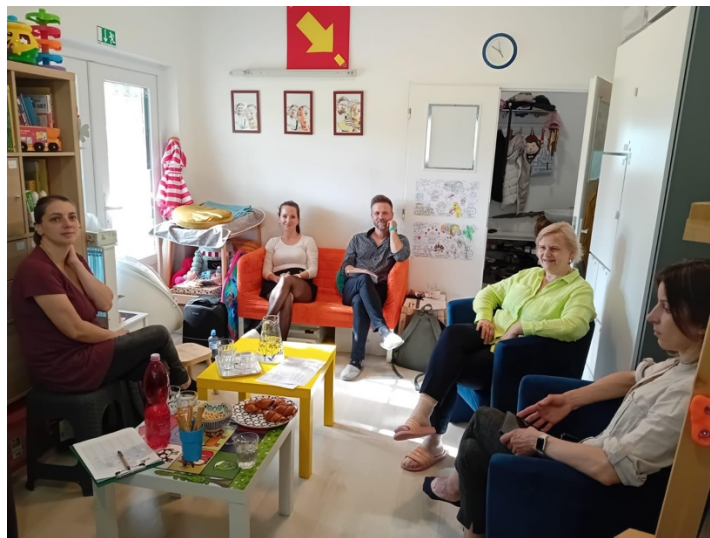
S rodičmi počas Tréningu rodičovských zručností v CVI TT