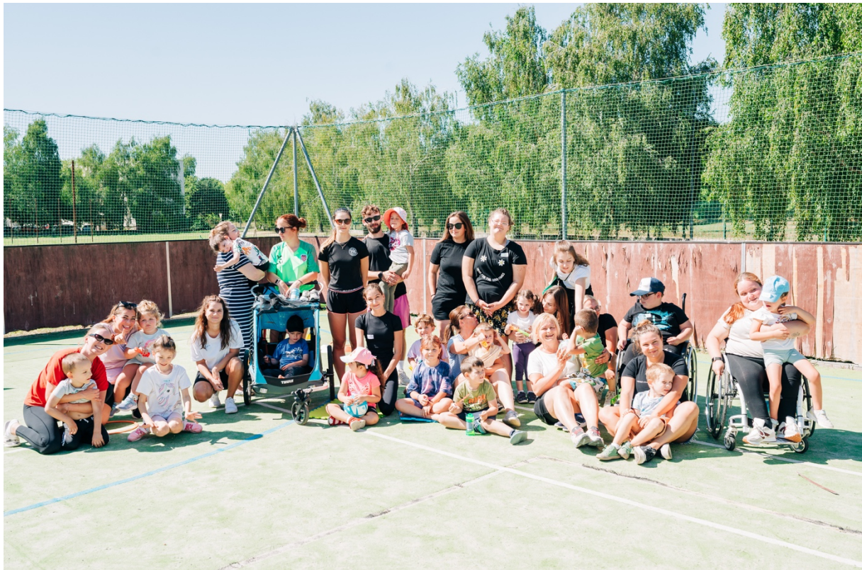
Dobrovoľníci a účastníci 6. ročníka Denného inkluzívneho tábora CVI TT