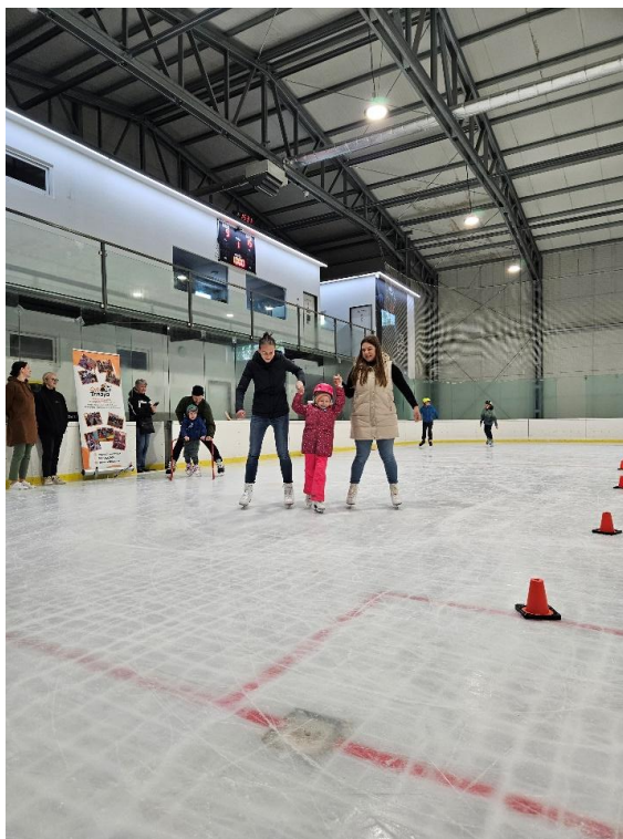
Korčuľovanie na ľade pre rodiny klientov CVI TT počas jarných prázdnín v marci 2024