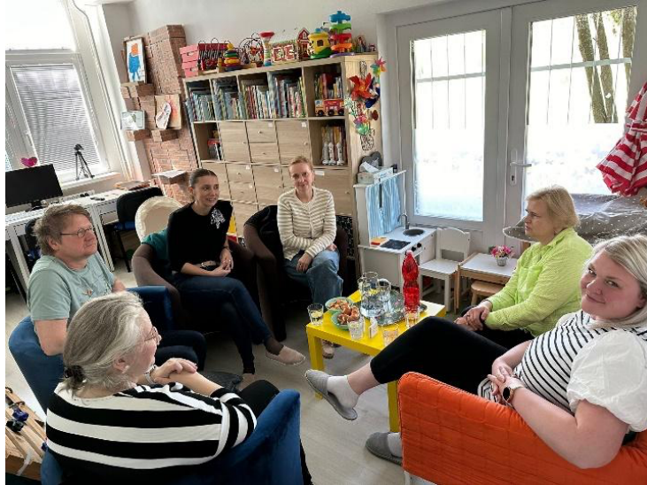
Zamestnanci CVI TT s pani viceprimátorkou Mesta Trnava a s p. vedúcou sociálneho odboru v priestoroch CVI TT

V priebehu roka 2024 sme pokračovali v poskytovaní služby včasnej intervencie predovšetkým rodinám detí so zdravotným postihnutím, avšak aj sieťovaním s dobrovoľníkmi, inštitúciami, samosprávami. Počas celého roka zamestnanci využili čas na vzdelávanie, supervíziu a školenia.