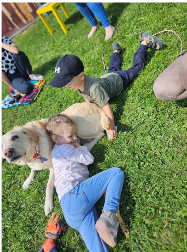
Krásny čas detí počas canisterapie v CVI Trnava