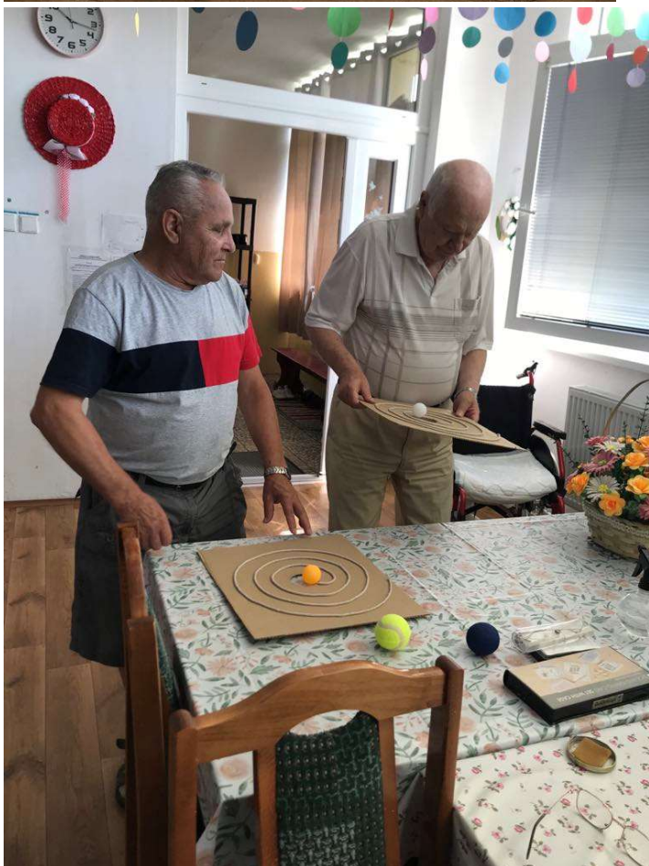
Športy a súťaženie to je najmä pánska záležitosť