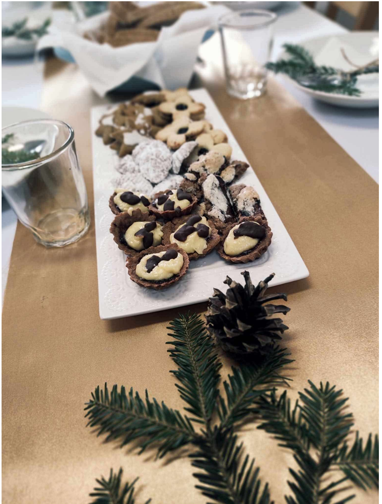
Stolovanie pri vianočnom posedení