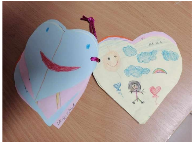
Aj my sme obdarovaní ručnou prácou