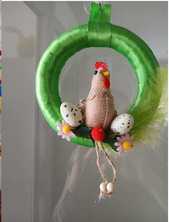
Naša ručná tvorba