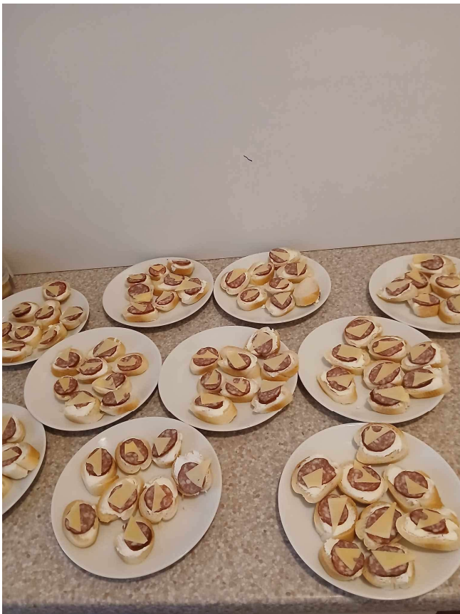
Radi si pochutnáme na našich domácich dobrotách