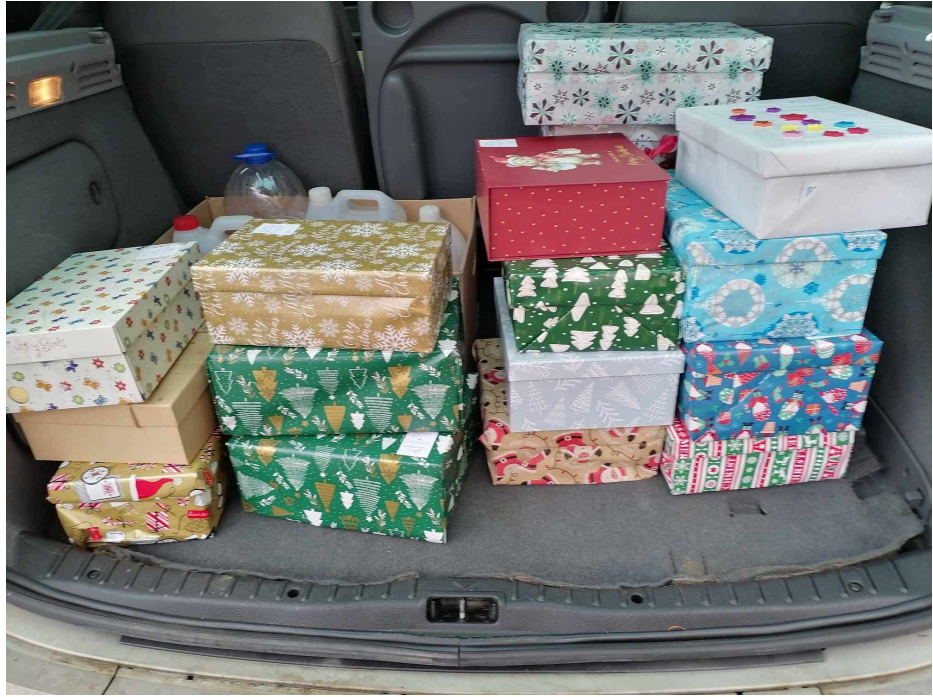
Stromček žiari, srdcia tiež.