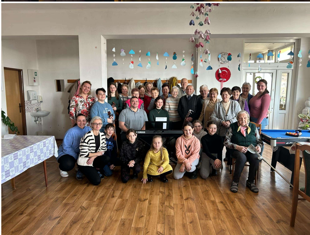
Otvorené srdcia, zdieľané príbehy.