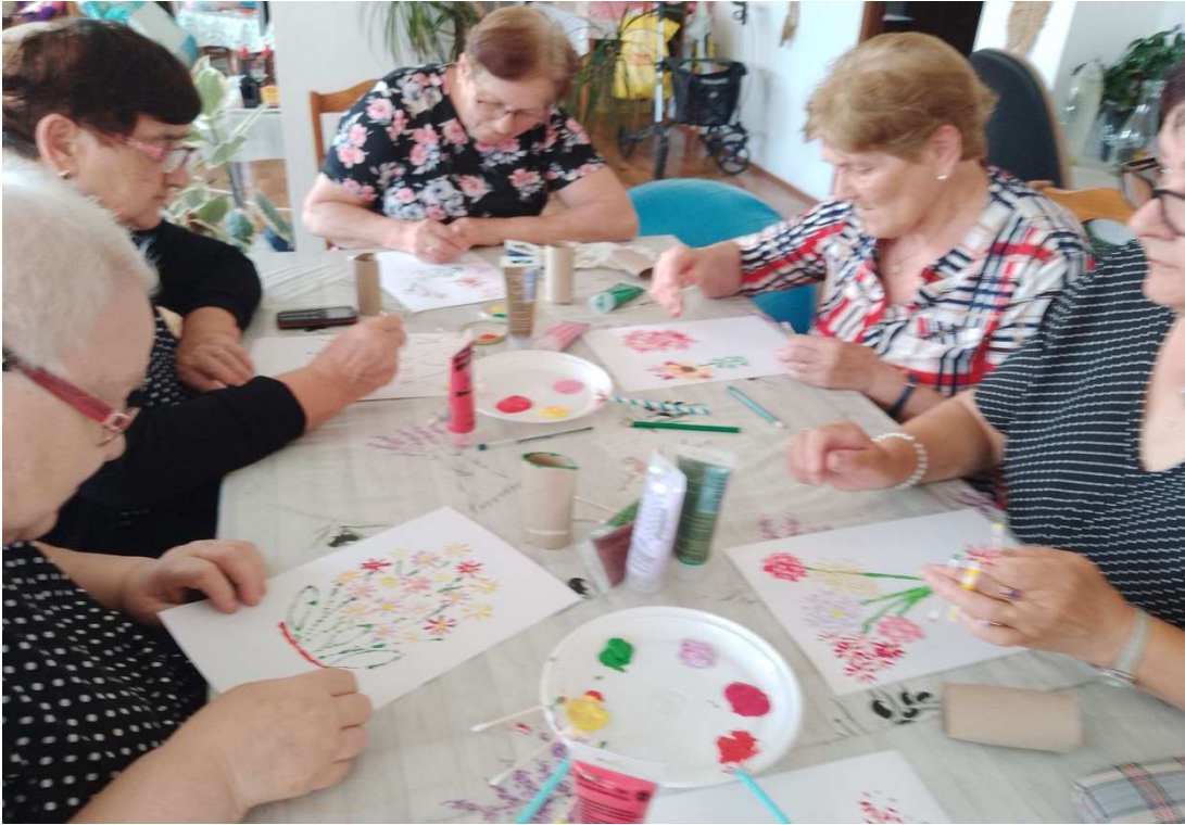
Bezpečnosť v dialógu a kreativita v pohybe.