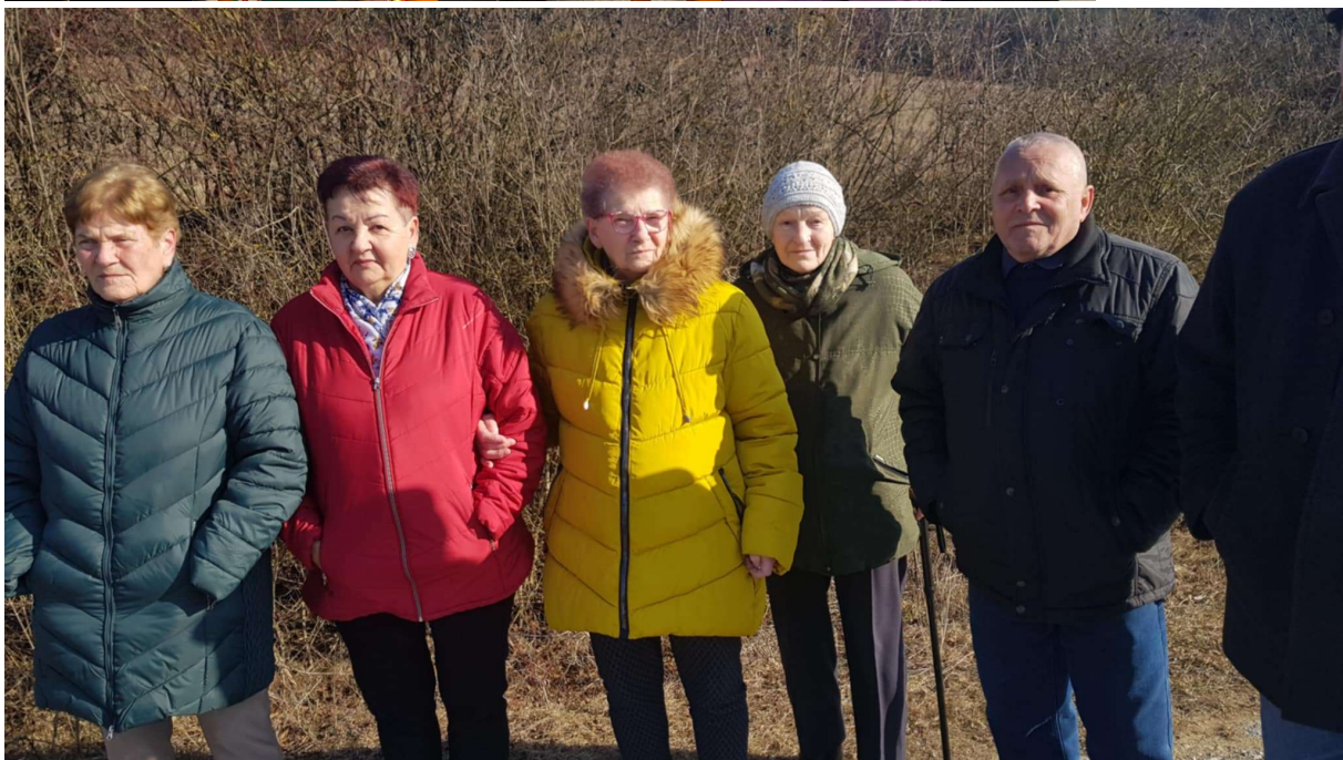
Spoločné chvíle, ktoré spájajú.