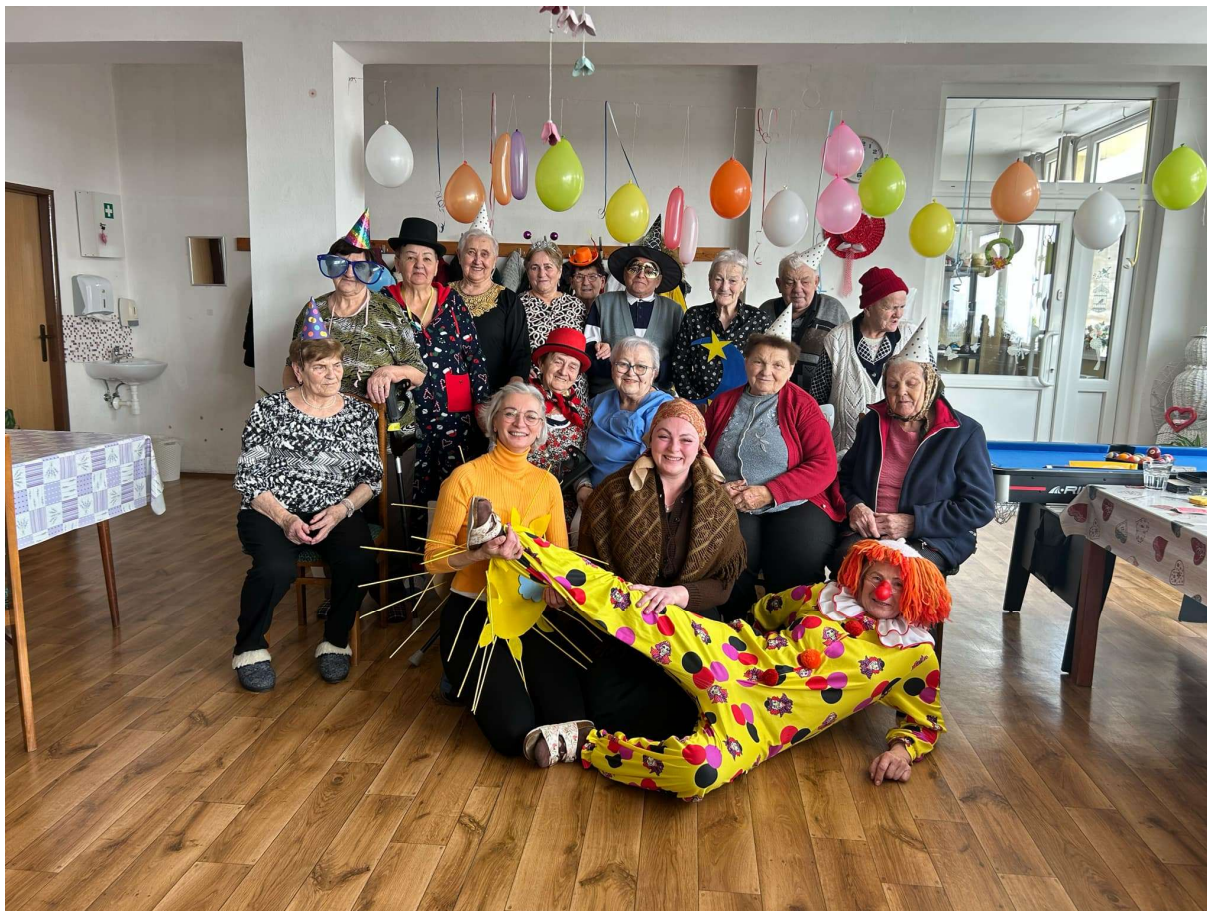
Každý deň prináša nové zážitky