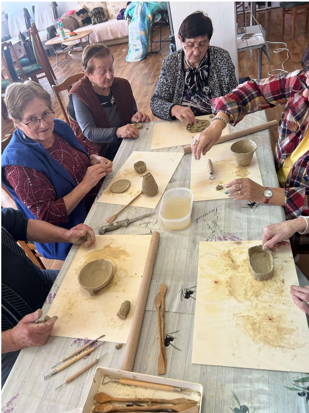
Ručné práce to nám ide, vždy sa niečo naučíme.