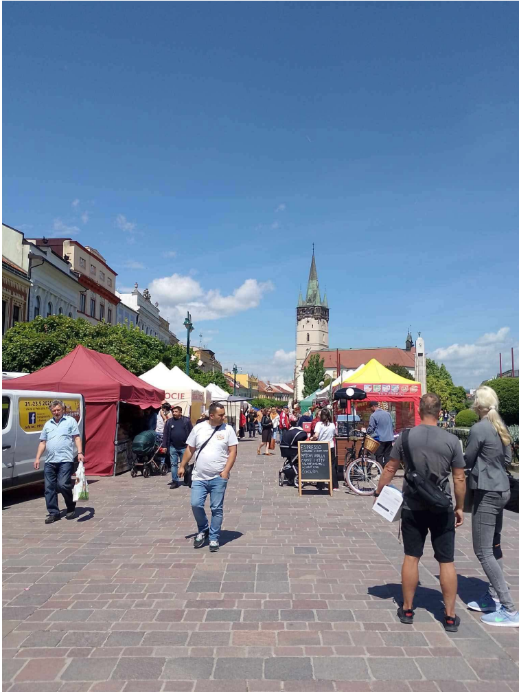
Spoločne za kultúrou