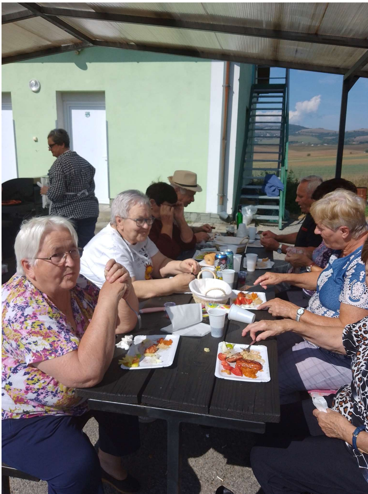
Letná pohoda pri grile: dobrá spoločnosť, dobré jedlo, dobrá nálada.