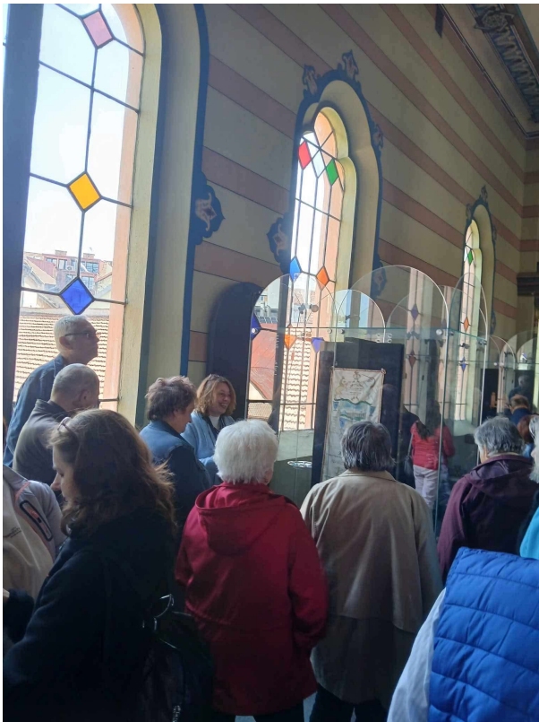
Exkurzia synagógy v Prešove