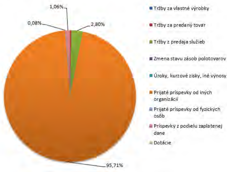
Prehľad príjmov Touch&Speech n.o. za rok 2024