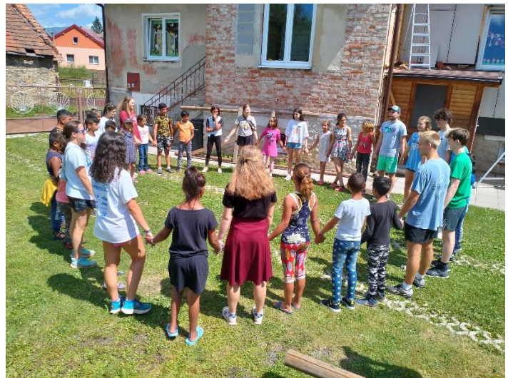
Výlety a atrakcie počas leta aj v spolupráci s misijným tímom z USA