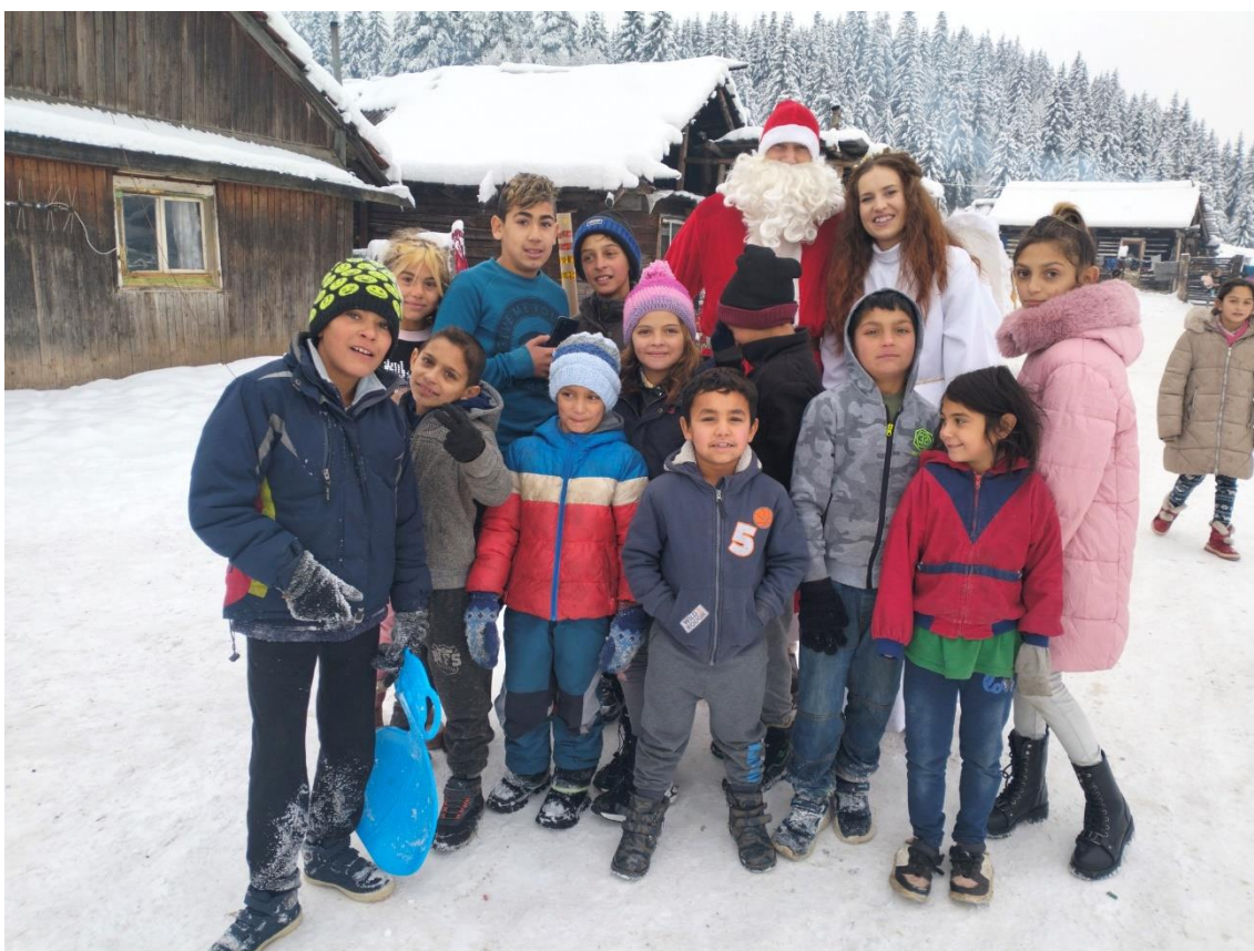
Výmena obvodového plášt'a na Detskom centre Samuel / Návšteva Mikuláša v miestnej komunite