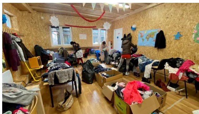
Hygienické balíčky ku dňu žien / Návnik hudobnej kapely z miestnej komunity / Výrobky detí / Burza šatstva