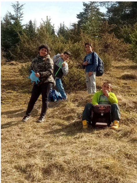
Brigáda pri príležitosti Dňa zeme