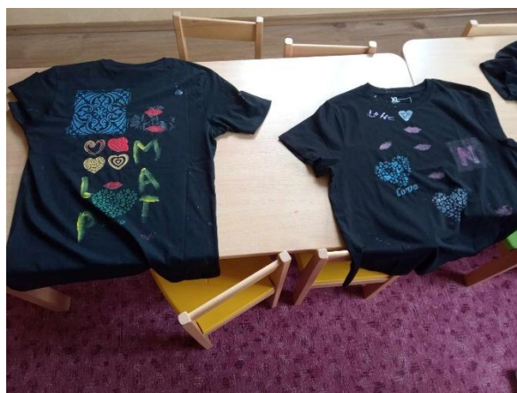
Maľovanie na tričká