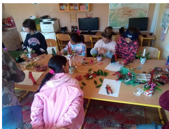
Výroba vianočných aranžmánov