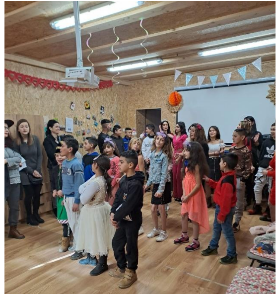
Karneval v Detskom centre Samuel