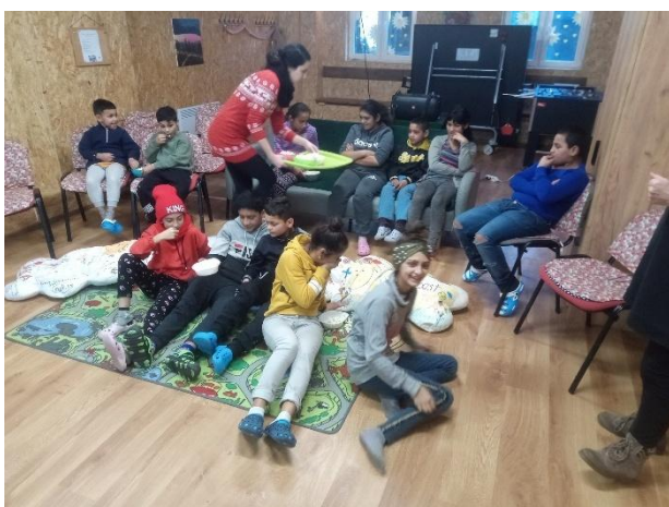
Kino v Detskom centre Samuel