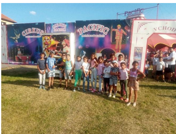
Návšteva cirkusu Pacific