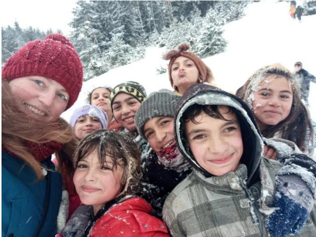
Sánkovačka vo Važci