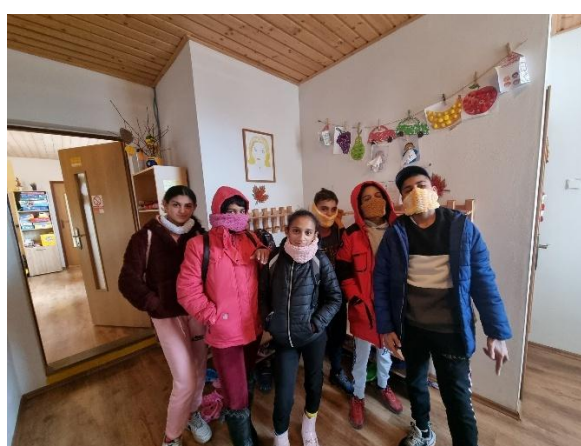
Výroba nákrčníkov a čeleniek