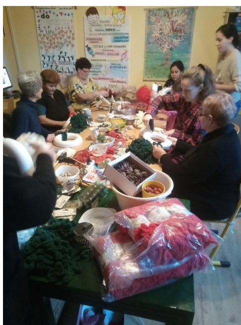
Vianočné vence – skupinka žien