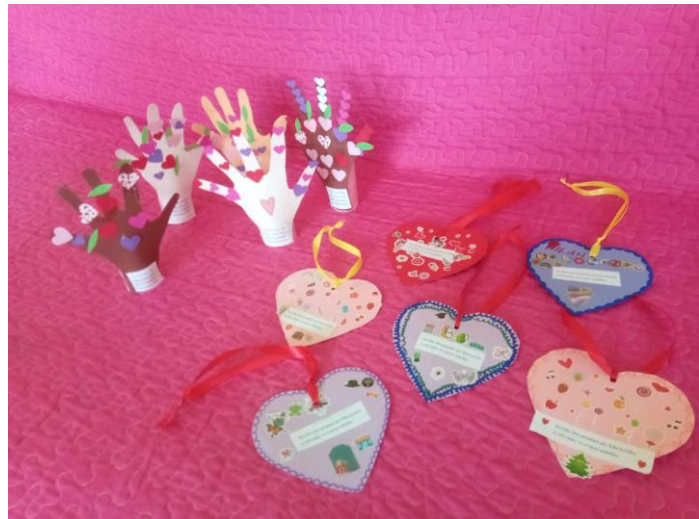
Výrobky detí pri príležitosti MDŽ