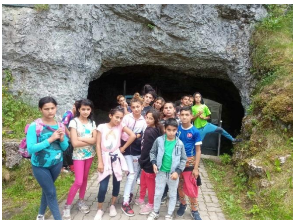
Návšteva Važeckej jaskyne