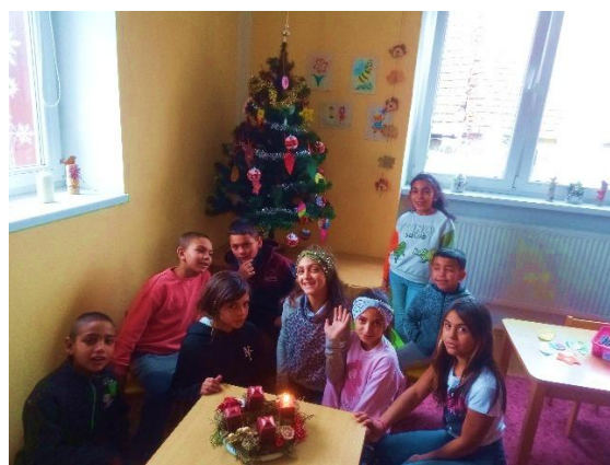
Vianoce u nás