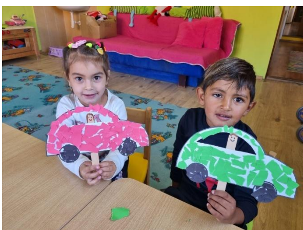
Vyrábanie s našimi najmenšími