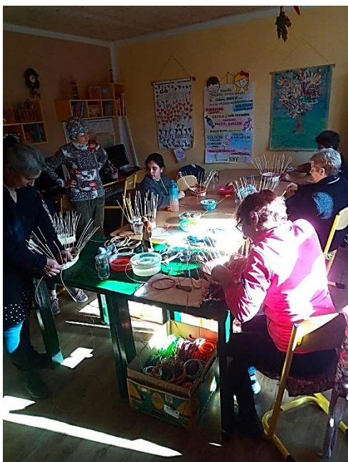
Vyrábanie z pedigu – skupinka žien