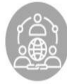
Otvorenosť a spolupráca