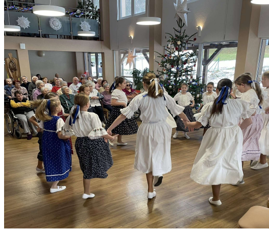
Niečo z nášho života.....