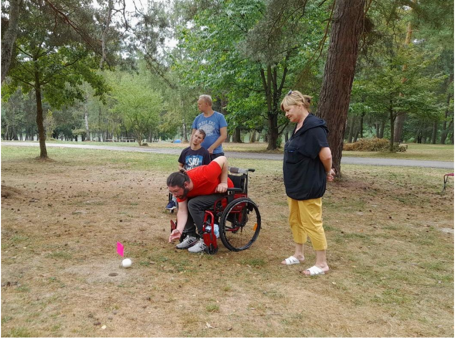
Športové sústreďenie hráčov bocce prebiehalo aj v exteriéri