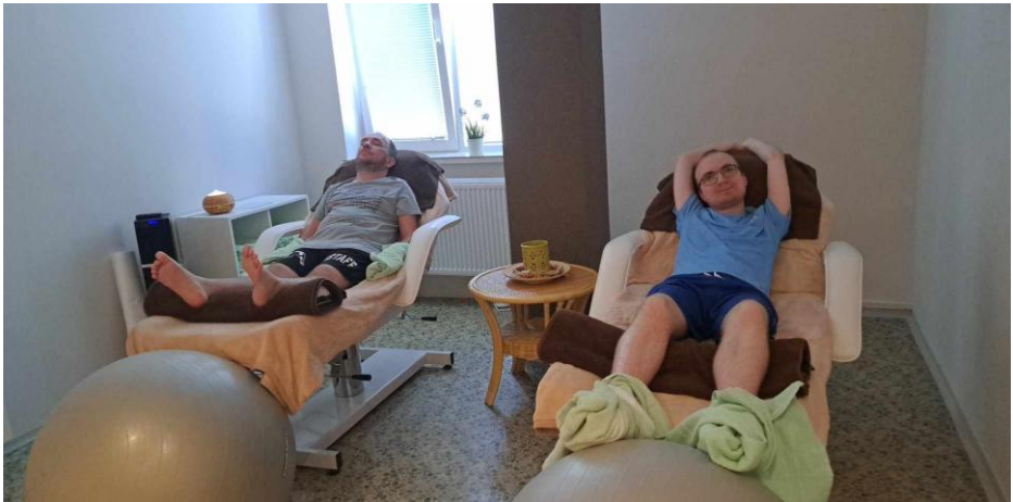
Procedúry na ozdravnom pobyte v plnom prúde