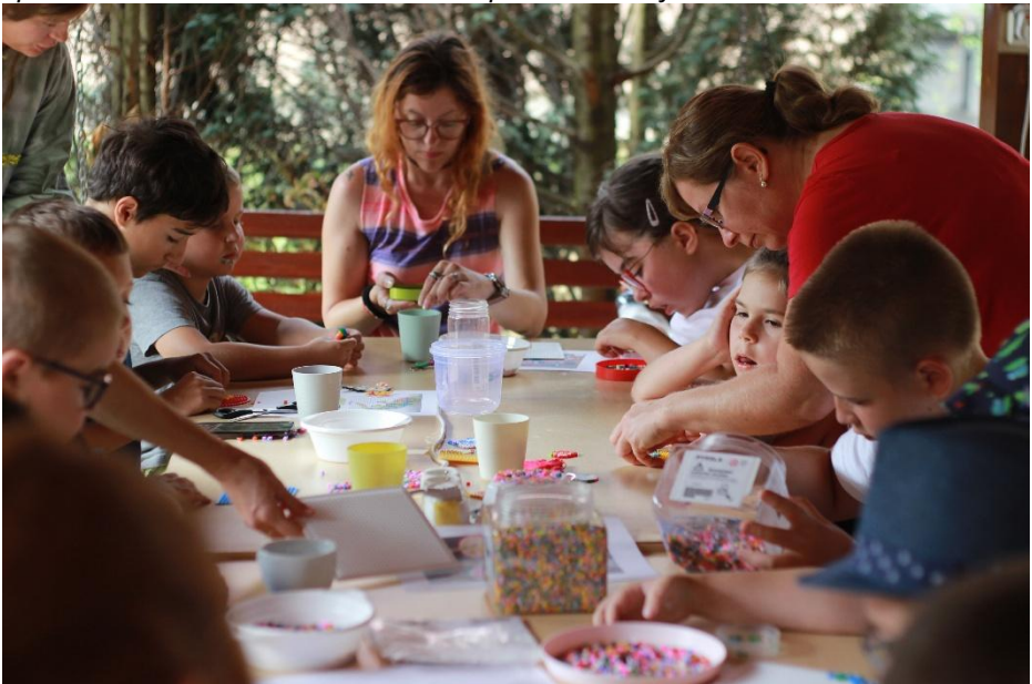
Tvorivé aktivity na detskom tábore