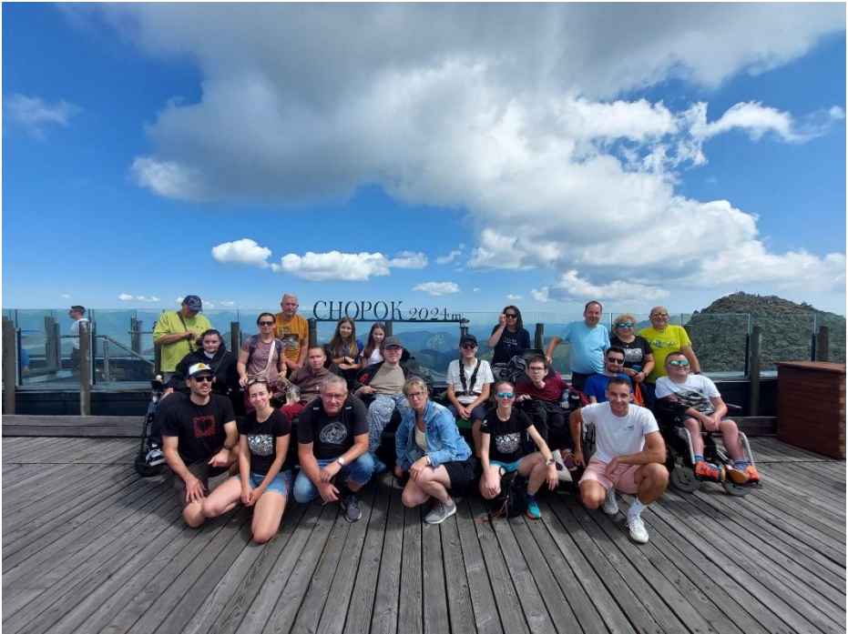
Plnoletá mládež na výstupe na Chopok