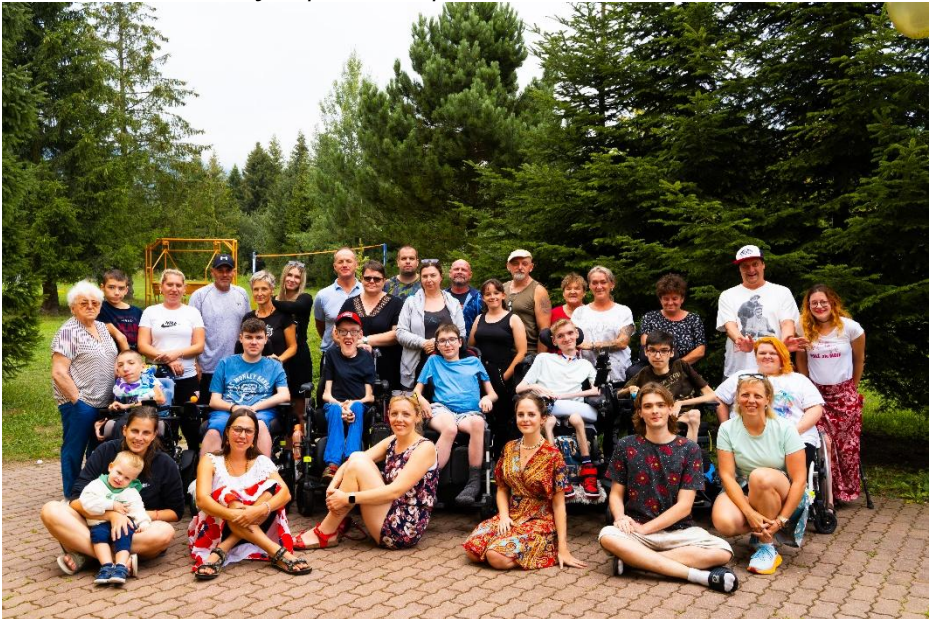
Účastníci tábora pre mládež