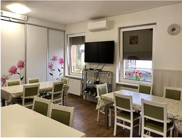
Obrázok 3 Jedáleň ZpS