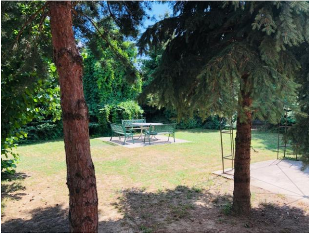
Obrázok 2 Záhrada ZpS

Ubytovanie je poskytované v dvojposteľových alebo trojposteľových izbách. Dve alebo tri izby tvoria bunku, pričom každá bunka je vybavená kúpeľňou a samostatnou toaletou.