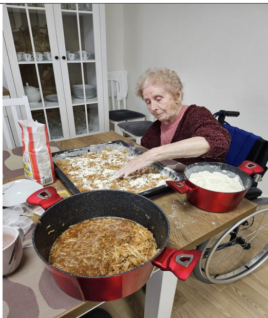
Obrázok 2 - Kuchyňoterapia - pečenie koláča