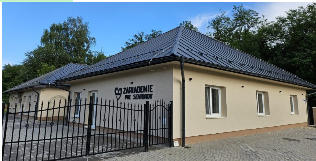
Obrázok 1 - Budova zariadenia