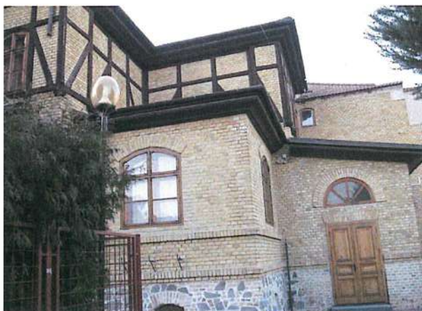
Staničný dom, začiatok 20. Storočia