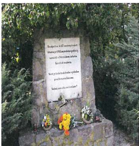
Pomník a spoločný hrob židovských obetí fašizmu

Prehľad pamätihodností Bratislavy – Petržalka :