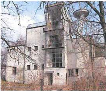
Nemecký veslársky klub, lodenica, solitér, r. 1931