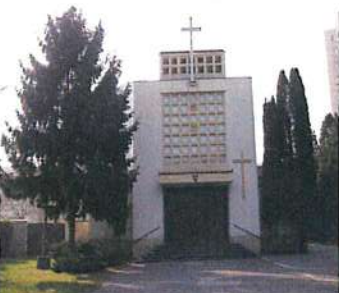
Rímsko katolícky kostol „Povýšenia Svätého Kríža“, r. 1931-1932