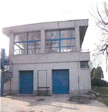
Slovenský veslársky klub, r. 1930