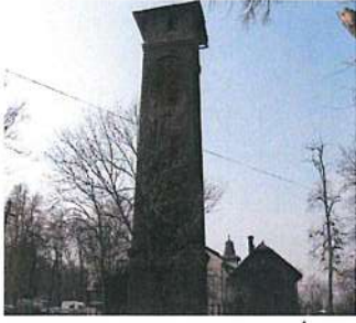
Aréna – dom strojníka vodárenskej veže