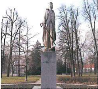
Janko Kráľ, básnik 1822-1876