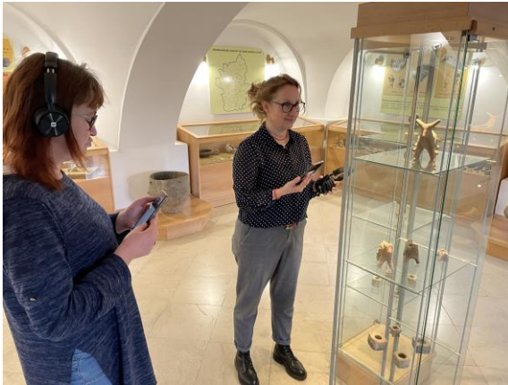
Využívanie HW so sprievodcom v expozícii múzea

Podpora efektívnejšej práce sprievodcov, ktorý potrebujú podporu pri vyššej návštevnosti bolo zameranie na tento rok. Cieľom aktivity bolo zabezpečiť, aby si návštevníci expozícií dokázali zažiť expozíciu aj individuálne s podporou elektronického audiosprievodcu Smart Guide. Aktivita bola pozitívne posúdená v expozíciách a bude pripravená na ďalšie etapy zvyšovania kvality služby v podobe zabezpečenia offline verzie sprievodcov a QR kódov, ktoré uľahčia prehliadku rôznych expozícií. Pripravuje sa aj jazyková mutácia, ktorá bude poskytovať služby aj zahraničným turistom.