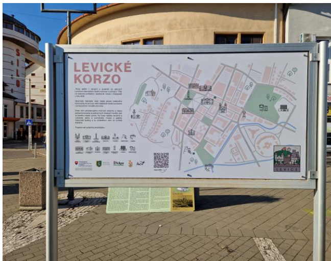
Nová osadená informačná tabuľa „Levické korzo“

Zlepšenie komunikácie atraktivít v meste Levice a orientácie vôbec na lepšiu orientovanosť v súvislosti s polohou atraktívnych cieľov a miest v centre mesta Levice bola jednoznačne jedna z najočakávanejších aktivít v sezóne roku 2024. Je to hlavne kvôli tvorbe novej komunikácie mesta a vytvorením novej ponuky objavovania zaujímavostí a služieb mesta na jednej línii, na Levickom korze. Týmto sme vytvorili novú atraktívnejšiu komunikáciu a ponuku spoznávať mesto „inak“ ako to bolo do teraz.