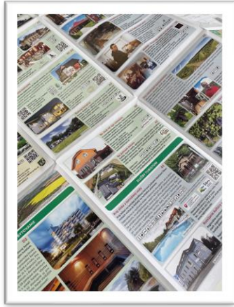
Ukážka propagácie produktu CR Kraj termálnej vody v mape VKÚ