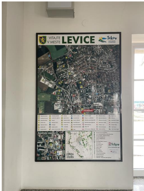
Komerčný priestor ŽS Levice – miesto pre turistickú mapu

V roku 2024 sme pokračovali v prenájme komerčnej plochy na Železničnej stanici mesta Levice. Nakoľko je to prvý kontakt návštevníka s mestom sme radi, že sa nám podarilo túto plochu dlhodobo rezervovať na účely prezentácie turistickej mapy, ktorú vytvorilo mesto Levice v predošlých rokoch. Táto aktivita je vysoko efektná a veľmi dôležitá pri príchode turistov do mesta, aby sa zorientovali a vedeli o najdôležitejších atraktivitách a cieľoch v meste.