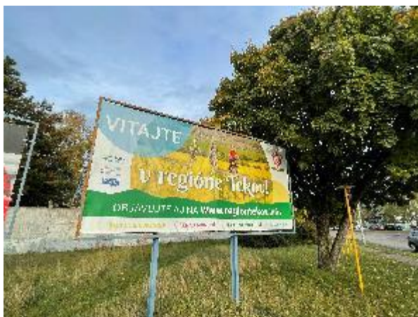
Ukážka plochy na Tlmačskej ceste

V roku 2024 sme zabezpečili prenájom komerčnej plochy v podobe billboardu na frekventovanej ceste spájajúcej dva spolupracujúce regióny na strednom a dolnom Pohroní. Snažili sme sa týmto spôsobom zabezpečiť komunikáciu destinačnej značky Región Tekov a možnosťou vyhľadať si ciele a produkty v regióne. Táto aktivita je vysoko efektná a veľmi dôležitá pri príchode turistov do regiónu, aby boli hneď komunikovaní vedeli o najdôležitejších atraktivitách a cieľoch v Regióne Tekov.