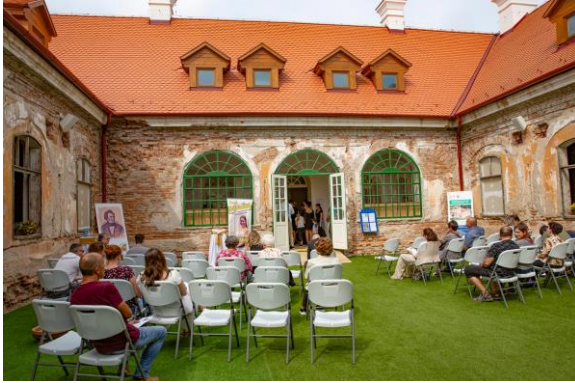
Jarná Schubertiáda 024

Aktivitu hodnotíme ako vysoko prínosnú, hlavne v tomto období, kedy sa venuje minimálna podpora kultúre a rozvojovým aktivitám v oblasti CR. Našou úlohou bolo zabezpečiť program, účinkujúcich pre podujatia, zabezpečenie materiálu na propagáciu a ubytovanie so stravou pre účinkujúcich pre všetky podujatia v spojitosti s podujatím ako Schubertfest v Želiezovciach.