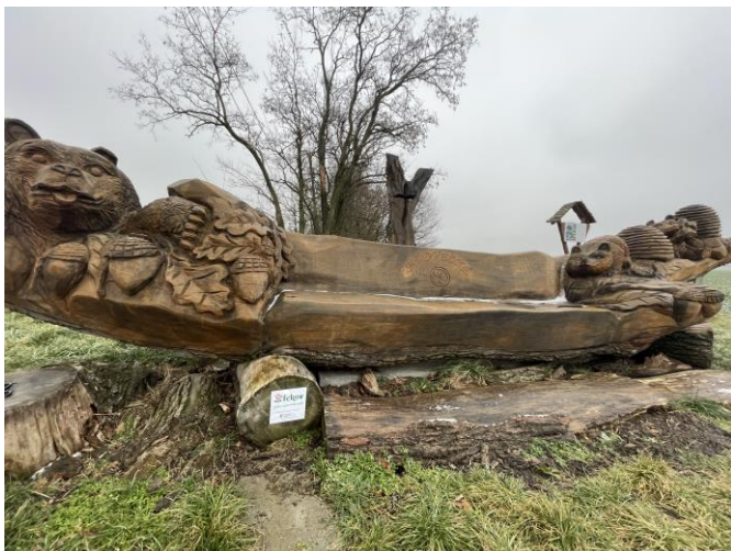
Obnova oddychovej lavice na značenej cyklotrase č. 5133

Rozvoj a obnova cykloturistickej infraštruktúry v regióne sa ukázala ako dôležitá aktivita počas uplynulých rokov. Zabezpečuje nevyhnutný rozvoj v oblasti cykloturizmu na zvýšenie návštevnosti rôznych cieľov a atraktivít regiónu a podporuje dopyt a tvorbu ponuky služieb na týchto trasách. Cieľom aktivity bolo vyrobiť nové informačné tabule na atraktívnych miestach pri značenej cyklotrase a obnoviť oddychové body v podobe lavíc alebo posedu z dubového dreva. Aktivitou sme poskytli atraktívnejšie trávený čas počas cyklotúry návštevníkov regiónu z termálnych zariadení.