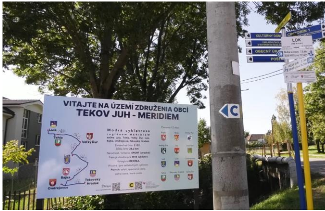
Informačná tabuľa a maľované značenie v obci Lok na trase č. 2122