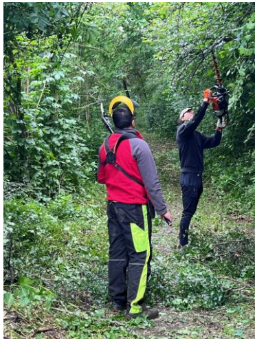
Úprava NCH Horšianska dolina

Starostlivosť a kosenie trávnatých porastov na náučných chodníkoch v Regióne Tekov. Vyznačené atraktívne náučné chodníky napríklad na levickej Kalvárii alebo NPR Horšianska dolina potrebujú na svoju udržateľnosť mať zabezpečenú starostlivosť, je to neoddeliteľnou súčasťou plánovania a propagácie cieľa v destinácií a vôbec celého regiónu. Náučné chodníky sú v našom regióne vysokým počtom návštev turistov jeden z top bodov záujmu, čo sa objavovania prírodných krás týka. Veľa z nich približujú aj historické udalosti miest a obcí, predstavujú prírodné jedinečnosti a ponúkajú trávenie voľného času pre ubytovaných v termálnych zariadeniach a preto považujeme tieto aktivity za potrebné a na niektorých miestach aj nevyhnutné na zabezpečenie ich udržateľnosti.