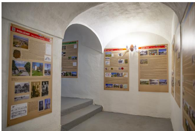
Ukážka prezentácie informačných panelov v historickej expozícii

Naším zámerom bolo podporiť a vytvoriť nový cieľ v podobe vytvorenia expozície histórie a tradícií v známom mikroregióne v „Kraji čilejkárov“ v obci Rybník. Obec je najstaršou vinohradníckou obcou s hlbokou históriou a v jej historickej budove pôvodnej kúrie sa tvorí expozícia histórie obce a geologického útvaru „Slovenská brána“. Neoddeliteľnou súčasťou expozície je aj prezentácia čilejkárskej kultúry s informačným bodom. Aktivitu považujeme za veľmi účelnú a cielene nasmerovanú na zvýšenie povedomia o vinohradníckej a čilejkárskej tradícii, zvýšenie návštevnosti a vytvorenie atraktívneho miesta pre záujemcov.