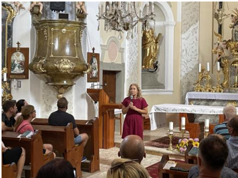
Sprievodcovský program „Baroko v Brhlovciach“

Organizácia sprievodcovských programov, zamerané na jedinečnosti v regióne, majú potenciál zviditeľniť tieto jedinečnosti a zabezpečiť povedomie obyvateľstva a návštevníkov o ich existencii. Je známy fakt, že nie len návštevníci, ktorí zablúdia k nám, ale aj samotní občania nemajú dostatočné povedomie o jedinečnostiach a unikátoch, na ktoré by sme mali byť hrdí a hrdo ich aj komunikovať a tvoriť naviazané produkty CR, ktoré by mali začať efektívne tvoriť regionálnu ponuku produktov CR a generovať zisk. Zámerom bolo zorganizovať viacero programov počas celého roku v mestách a aj v vzdialenejších miestach regiónu v pôsobnosti OCR. Snažili sme sa ich naviazať na ďalšie podujatia, čím sme ponúkli komplexnejšie programy pre návštevníkov. Z viacerých programov sa vytvorili veľmi príjemné podujatia, ktoré zapájajú do aktivity viaceré lokálne subjekty. Veľmi si vážime zapálenosť týchto aktérov a berieme to za potvrdenie správneho smerovania v podpore a tvorbe spomínaných programov.