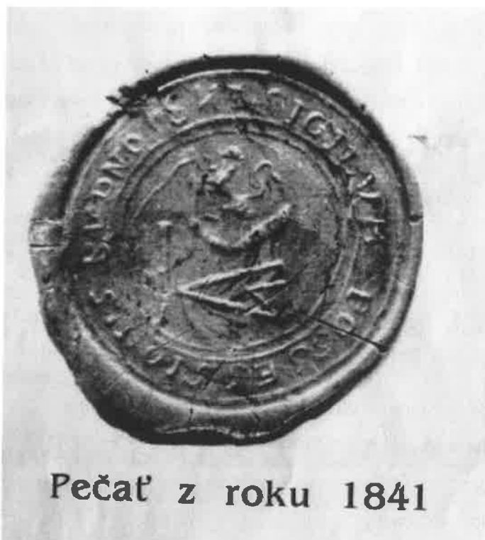
Pečať z roku 1841