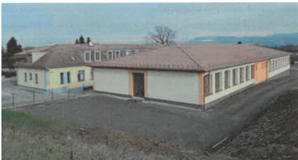
Obrázok: Modulová časť Súkromnej základnej školy

V máji 2018 boli slávnostne odovzdané nové priestory, v ktorých sa začalo vyučovať od septembra 2018. Táto stavba modulej sa ukázal ako najrýchlejší a finančne najefektívnejší spôsob výstavby bol navrhnutý prostredníctvom tzv. kontajnerovej stavby. Nová modulová stavba sa s pôvodnou budovou prepojila spojovacou chodbou. Dokončené krásne a moderné priestory sa stali deťom a pedagógom odmenou za prechodné stiesnené podmienky. Celková investícia budovy Súkromnej základnej školy je majetkom Obce Kechnec v hodnote k 31.12 2024 - 2 247 689,10 Eur .Všetky nové priestory sú vybavené.