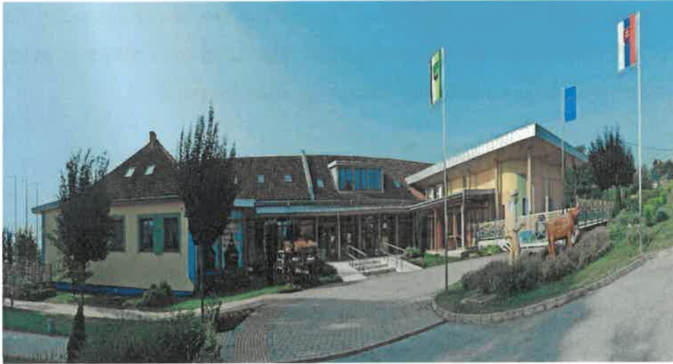
Obrázok: Pôvodná budova Súkromnej základnej školy

Súkromná základná škola v roku 2024 bola v prevádzkovej časti podporovaná a financovaná zo zdrojov: Obce Kechnec, Obecného združenia občanov telesnej kultúry, školstva, zdravia a ochrany ŽP Kechnec (zriaďovateľ), MŠVVaŠ SR, Ministerstvo vnútra prispieva na vyučovací proces v podobe normatívnych a nenormatívnych finančných prostriedkov