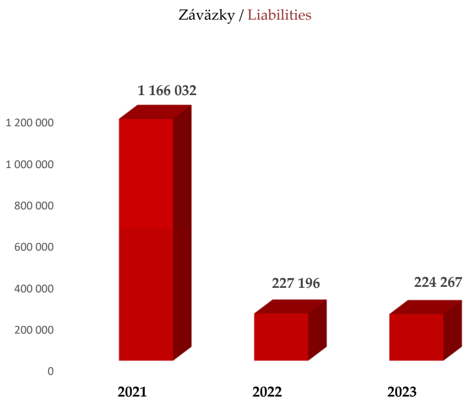
Tab. č. 5: Zmeny ukazovateľov vlastného imania a záväzkov / Changes in the Liabilities and equity development :