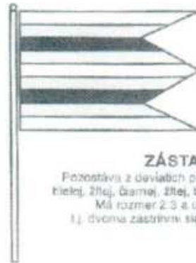
ZÁSTAVA OBCE Pozostáva z deviatich pozdĺžnych pruhov vo farbách čiernej, žltej, čiernej, žltej, bielej, žltej, čiernej, žltej a čiernej. Má rozmer 2:3 a ukončená je trojmičipmi t.j. dvoma zástierkami siahajúcimi do tretiny jej listu.