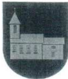
ERB OBCE V diamom šíte strieborný romákosťechý zlatokrný kusol so zlatým krížikom na vsiži