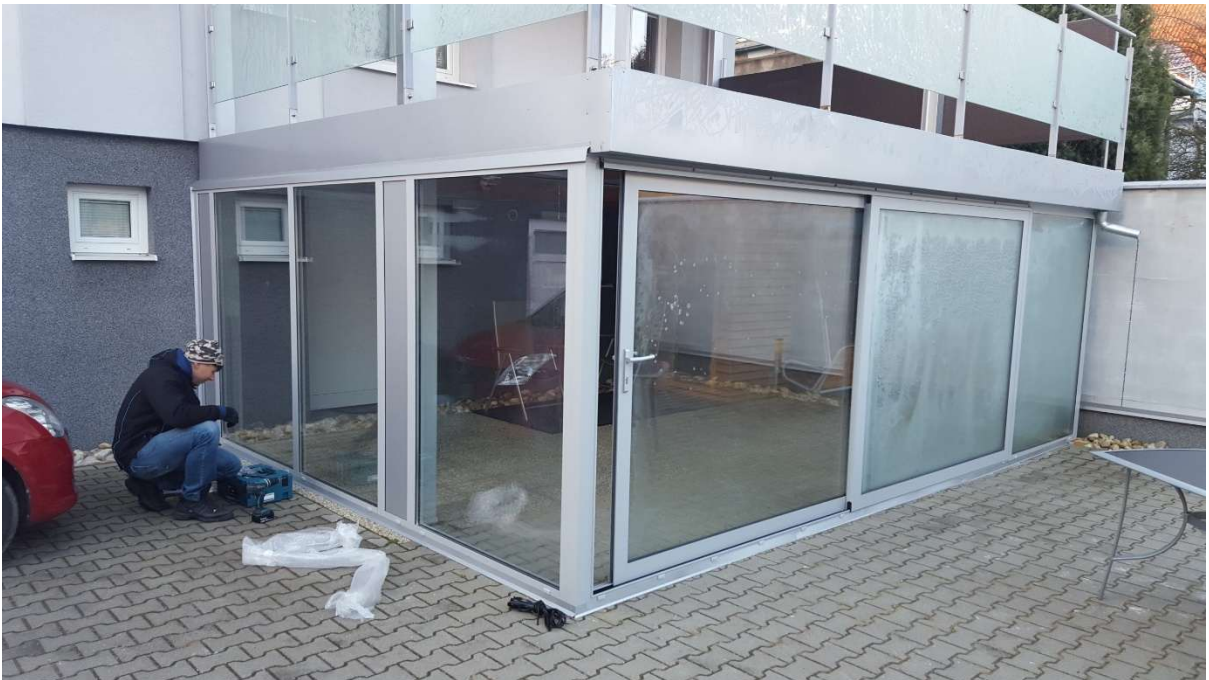
Presklenie terasy Bojnice