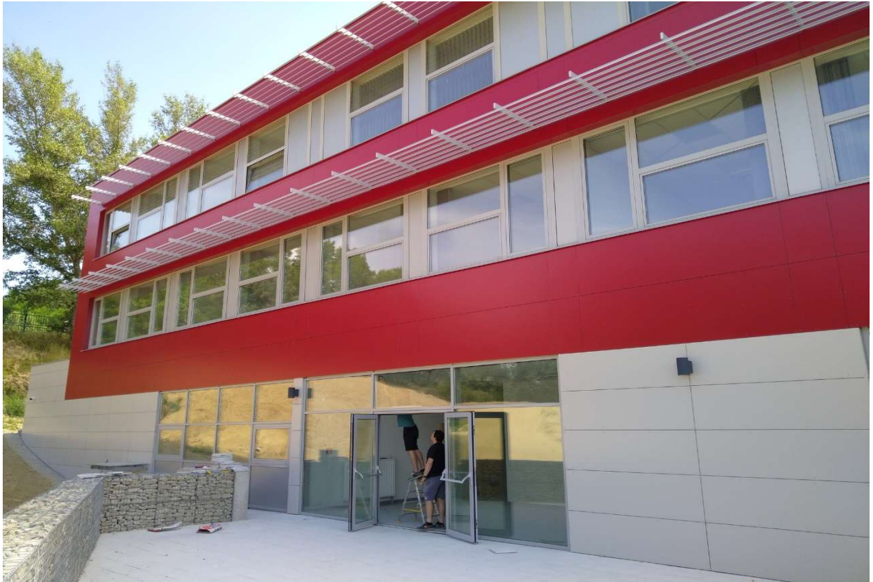
Univerzita Komenského Bratislava