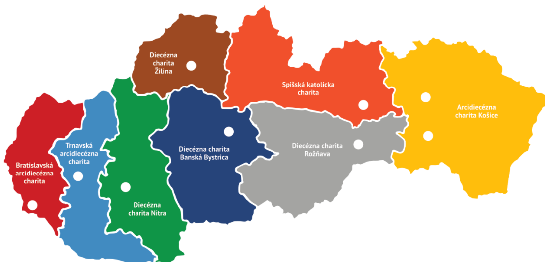
Obr. Rímskokatolícke charity

Členmi konfederácie SKCH sú: Bratislavská arcidiecézna charita, Trnavská arcidiecézna charita, Arcidiecézna charita Košice, Diecézna charita Nitra, Diecézna charita Žilina, Diecézna charita Banská Bystrica, Spišská katolícka charita, Diecézna charita Rožňava, Gréckokatolícka eparchiálna charita Bratislava, Gréckokatolícka eparchiálna charita Košice a Gréckokatolícka charita Prešov.