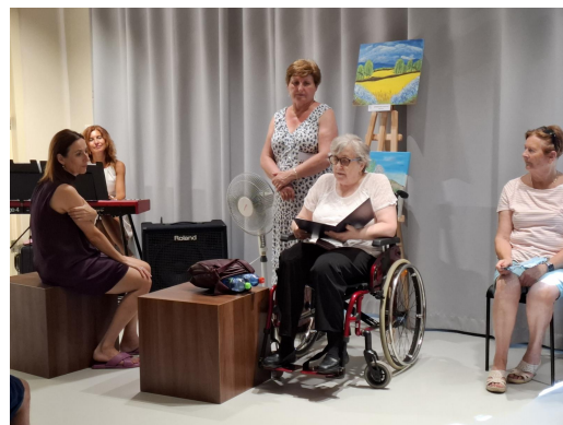
otvorenie výstavy v Leviciach