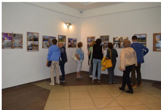
výstava v Devínskej Novej Vsi