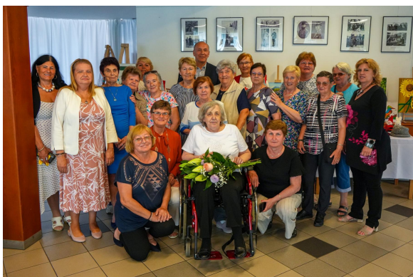
otvorenie výstavy v Ivanke p/Dunaji