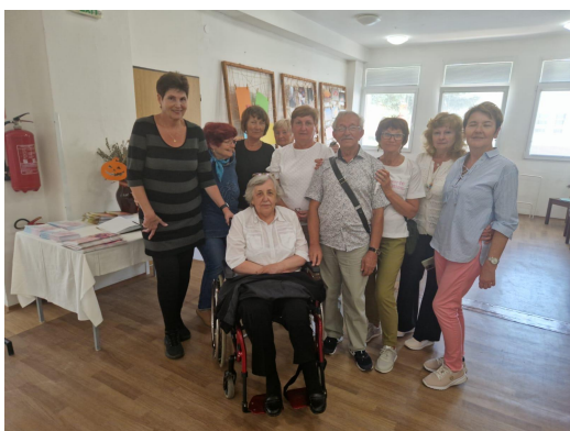
výstava v Brezovej pod Bradlom

Prvé kolo výstavy sa uskutočnilo v Chorvátskom múzeu v Bratislave m.č. devínska Nová Ves v termíne 14.5. – 31.5.2024 pod záštitou starostu m.č. DNV a druhé kolo sa konalo vo výstavných priestoroch Denného centra Brezová pod Bradlom v termíne od 23.9. – 4.10.2024. Výstava bola organizovaná pod záštitou primátora mesta.