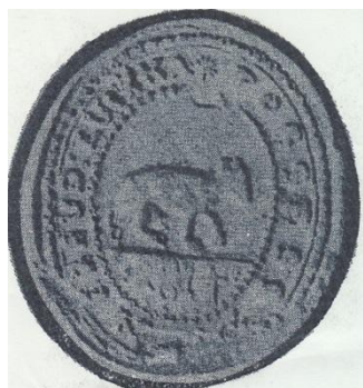
(pečať obce z roku 1814)

Návrh erbu bol ideovým námetom, vytvoreným na základe rozboru najstaršieho známeho heraldického prameňa - spomínanej obecné pečate. Pri vlastnom výtvarnom spracovaní bolo pritom potrebné v čo najvyššej miere zohľadniť tvar a podobu pôvodného znamenia z tejto pečate. Vzhľadom na jej vek nevedeli presne určiť, či je na nej zobrazený medveď alebo ovca, čo viedlo k pochybnostiam, ale zo Štátneho archívu v Bytči bolo nakoniec potvrdené, že je to medveď.