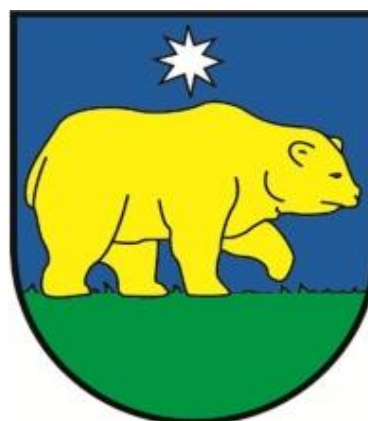
(erb obce Nezbudská Lúčka)

Takáto podoba erbu obce Nezbudská Lúčka bola prijatá do platnosti na základe odsúhlasenia obecného zastupiteľstva 5. mája 2005. Na tomto zasadnutí bol prijatý a teda aj schválený ďalší symbol obce, ktorým je obecná vlajka. Tá pozostáva zo štyroch pozdĺžnych pruhov vo farbách bielej (1/9), modrej (2/9), žltej (3/9) a zelenej (3/9). Vlajka má pomer strán 2:3 a ukončená je tromi cípmi, t.j. dvomi zástrihmi siahajúcimi do tretiny jej listu. Symboly obce Nezbudská Lúčka sú zapísané v Heraldickom registri Slovenskej republiky pod signatúrou N-.112/2005.